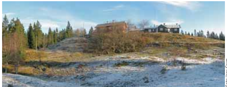
Frønsvollen med den første sneen ifjor.