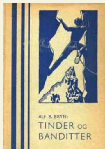
Alf B. Bryn Tinder og banditter Opplevelser i Alperne og på Corsica 230 sider, 16 upaginerte sider med fotos, og et detaljert kart Johan Grundt Tanum Oslo 1943

Boken er et fornøyeelig gjensyn for en som nå ser toppene nedenfra og vertshusene innenfra, i motsetning til langt tidligere (i all beskjedenhet), toppene ovenfra og vertshusene utenfra. Friluftsliv er ikke bare en alvorlig sak hvor man finner seg sjæl, det er også FF