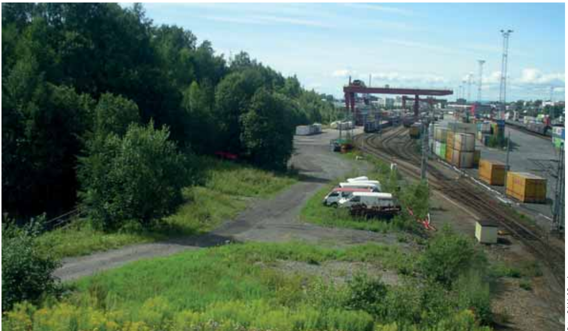
Alnaelva kan gjenåpnes og sammen med en turvei 'kiles' inn mellom NRF-tomta som vi ser en del av til venstre, og godsterminalen.

Oslo Elveforum, OOF og NOA, har i flere år diskutert mulige løsninger med Plan- og bygningsetaten, Oslo kommunes eget planleggingsorgan. Begge deres alternativer får til det som er hensikten med planarbeidet, som er å legge til rette for en ut-