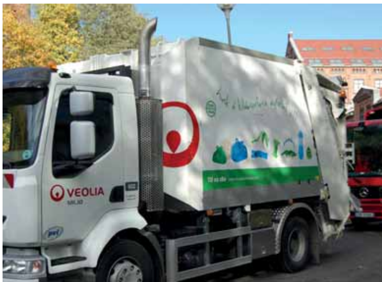
De nye renovasjonsbilene som går på biogass.