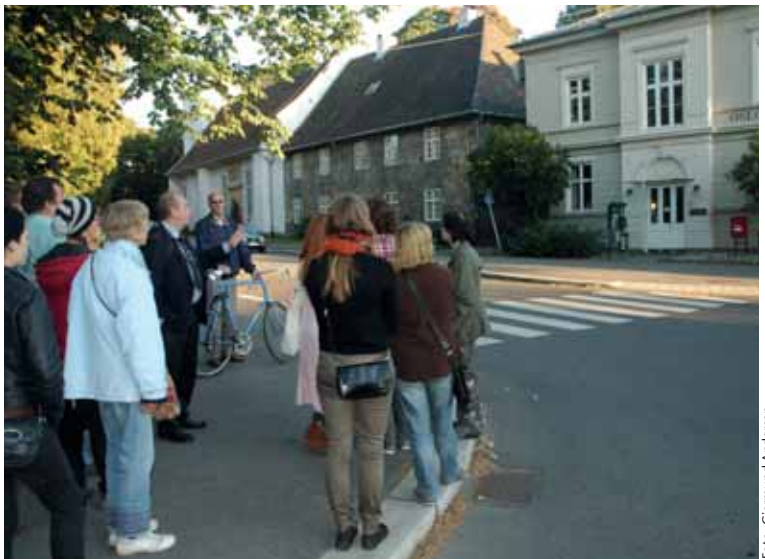
En stopp utenfor Oslo Hospital.