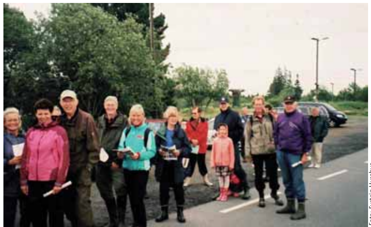
Noen av deltakerne før avmarsj.

Vi fikk et prosjektbidrag på 8000 kroner fra NNV, som vi takker for.