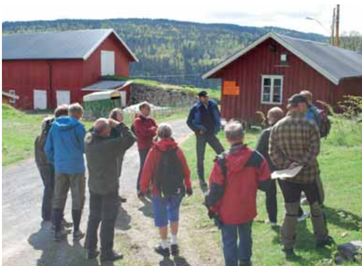
Befaring ved Isi gård.

I ettertid er Grevlingen kjent med at Natur- og idrettsforvaltningen har sendt brev til grunneier med forslag til bruksrettsavtale der turveien legges langs eksisterende vei. I bruksrettsavtalen tilbyr Bærum kommune grunneier noen skjermingstiltak inn mot tunet samt to større grunder som kan benyttes til å lede storfeet over veien. Denne saken har pågått i mange år og løser den seg i løpet av høsten har BNF vist sin berettigelse som løsningsorientert vaktbikkje og pådriver for det enkle friluftslivet i Bærum.