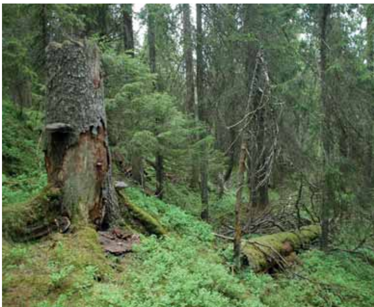
Nordenden av området Velohøgda.

Nå går kampen inn i en ny fase. I Marka er det nå friluftsliv og naturvern som skal gå foran næringsvirksomhet, og vi skal kunne verne områder av hensyn til friluftslivet og naturopplevelsene alene. Denne hjemmelen har vi argumentert for i ti-år, nå har vi fått den – og nå skal den brukes! Gled dere!