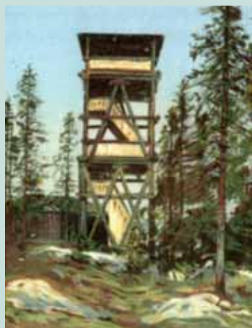
...hvor jeg bessaa det nye Udsigtstaarn, Besserudtaarnet.