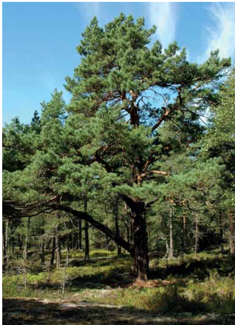
Gammel furu i Vestby.

Kjennetegn på naturlig skog er blant annet en variert alderssammensetning, en del døde trær (stående eller liggende,