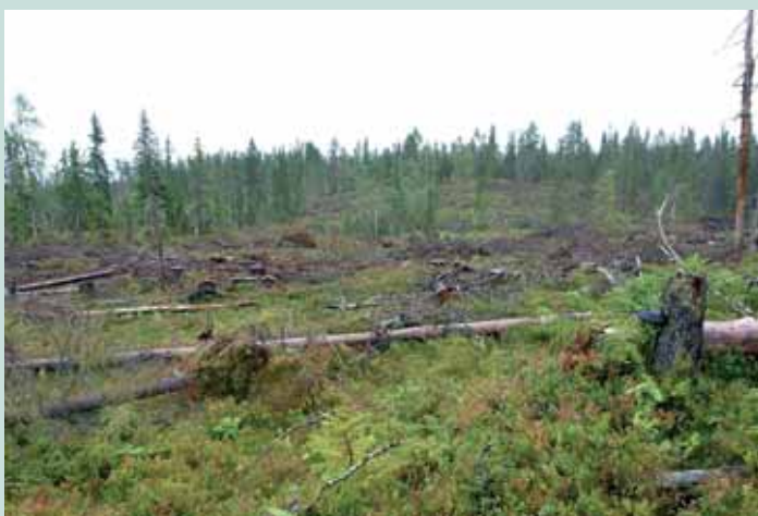
Hogstfelt nr. 1 nord for Stormyrtjernet den 26. august 2010