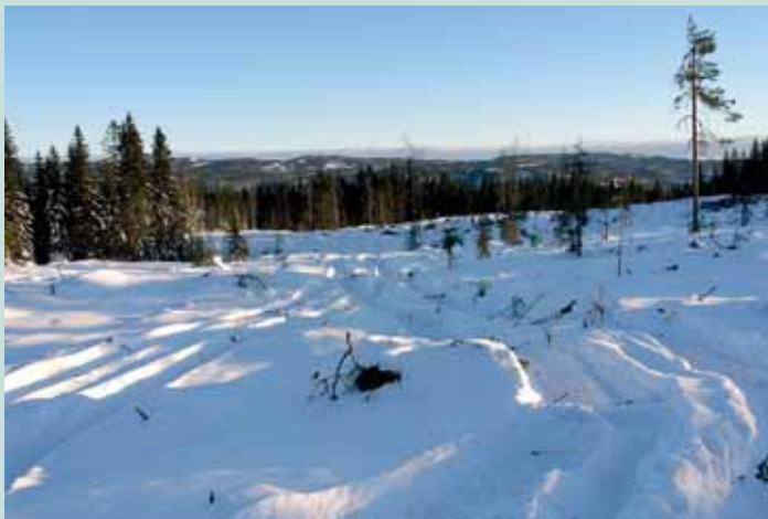
Hogstfelt nr. 24 nord for Stormyrtjernet den 11. januar 2010

Det er ufattelig for meg at ikke Norge har råd til å ta bedre vare på Marka, som er vår mest benyttede utmark, ved å kompensere skogeierne skikkelig for vern eller ved å subsidiere plukkhogst slik at inngrepene i naturen blir sterkt redusert.