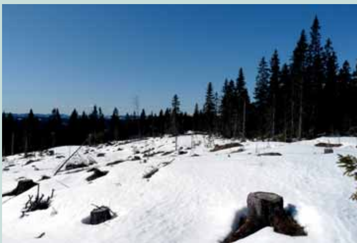
Hogstfelt nr. 22 syd for Øskjevallsbrenna den 24. april 2010