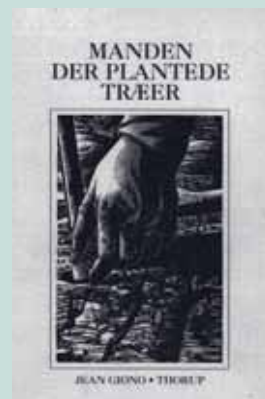
Jean Giorno Manden der plantede træer Oversatt til dansk av Bert Blom Forlaget Thorup 1995 40 sider, med Bloms essay og litteratur, 47 illustrert med tresnitt.

Penguins Companion to European Literature vier ham en hel spalte, og fremhever at det er rikdommen i språket og flammen i poesien, sammen med hans livfulle fantasi, som fanger lesernes fulle oppmerksomhet.