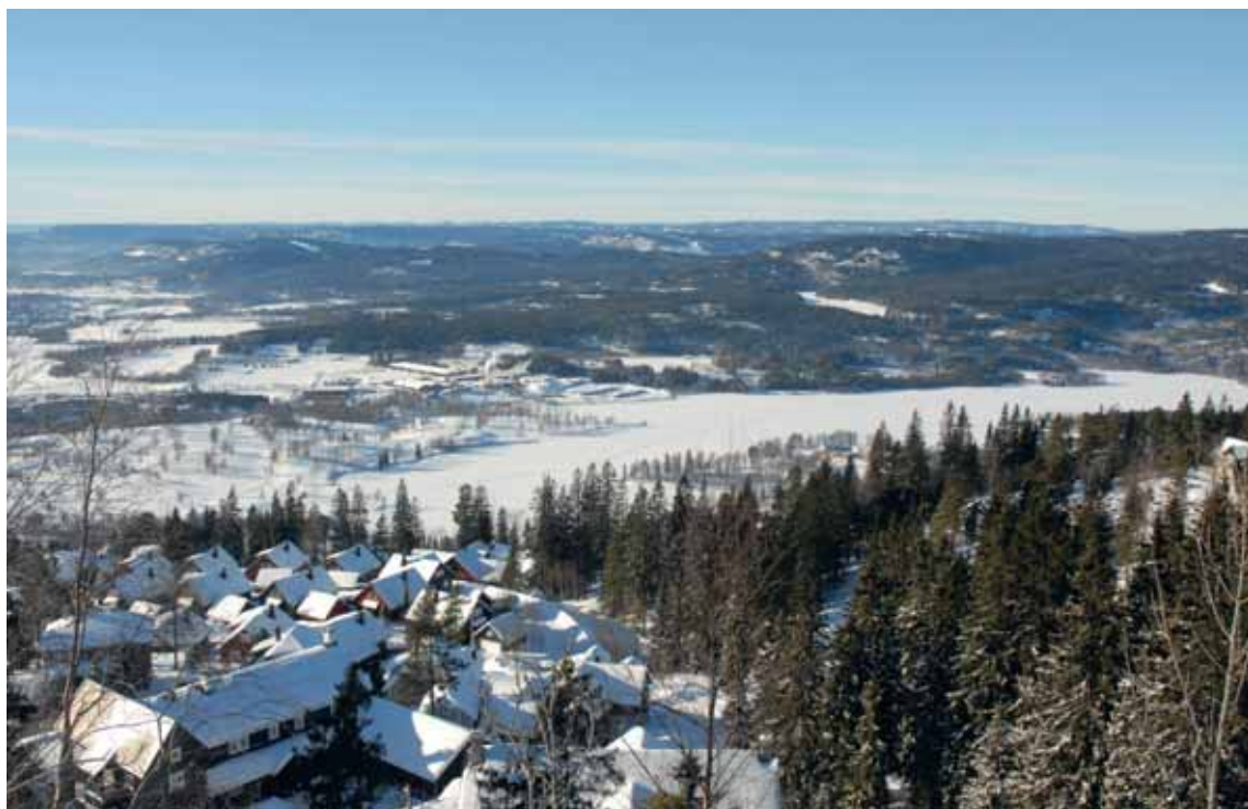
Utsyn over Bærumsmarka, Fossum Bruk, Bogstadvannet og Bogstad gård.