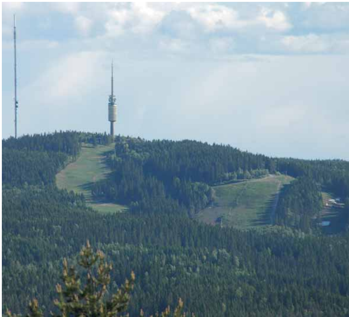
Tryvannsåsen på avstand.

plass til begge interesser, både naturopplevelse og uorganisert turliv, og til tilrettelagt og/eller organisert trening og aktivitet. Løsningene ligger i soneinndeling og samlede planer. Og prinsippene som må følges i planleggingen er bevaring av sammenhengende områder der naturen får dominere, samling og konsentrasjon av tyngre inn-