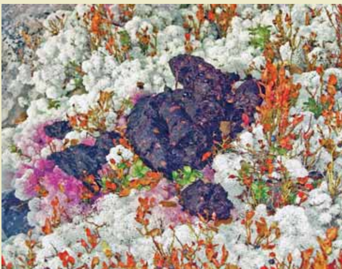
Bjønnemøkk i Härjedalen, 2006.