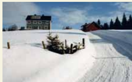
Trantjern anno 2010.