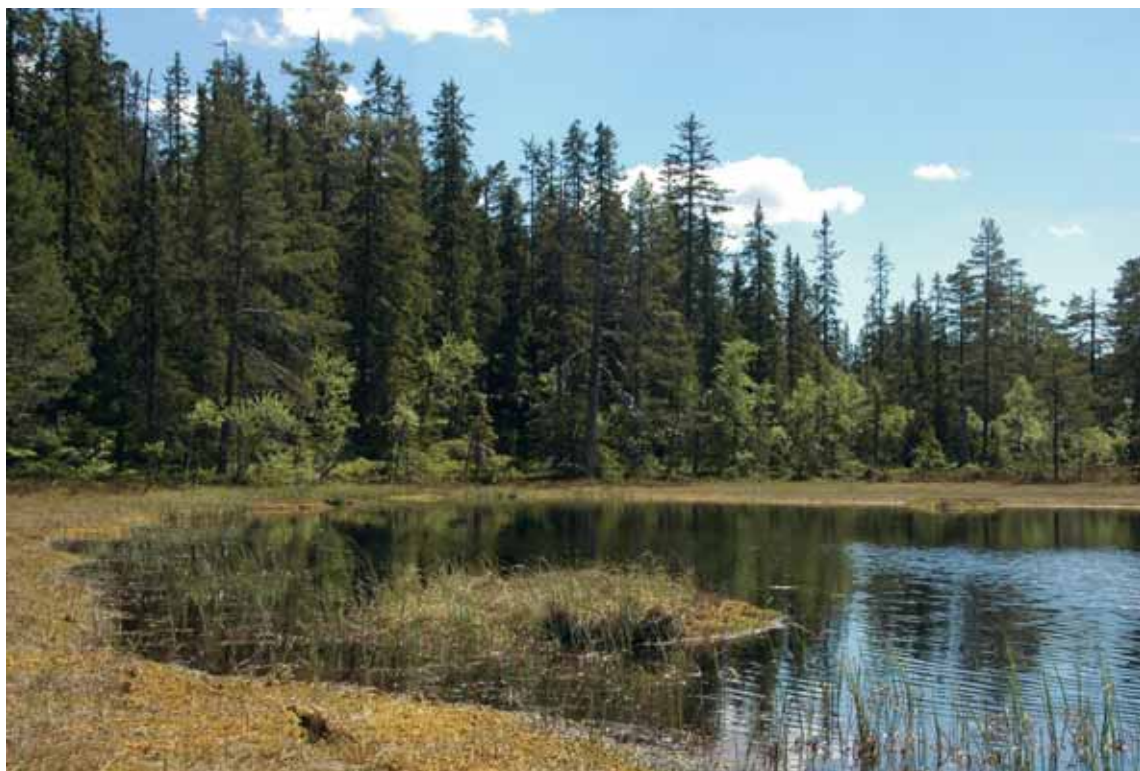
Det er slike skogsrom vi drømmer om. Her fra Spålsberget.

Vi har fått en ny lov, Markaloven, og med den, hvor den skal gjelde og for hvem den skal gjelde. Sentralt i forvaltningen