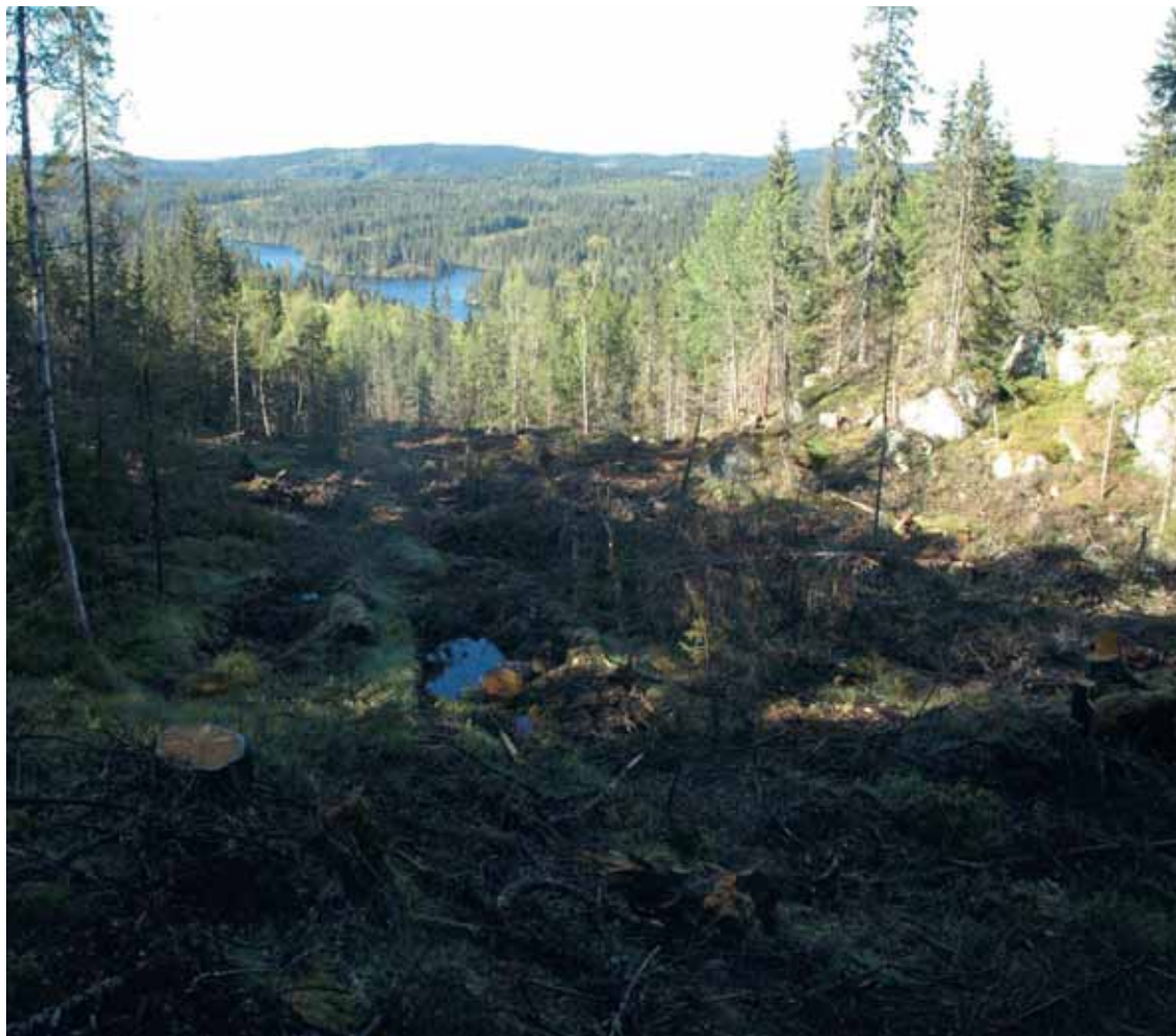
Hogst i Mosjøbrenna, en del av det store Langvassbrenna-området.

skognæringen og det senterparti-styrte Landbruksdepartementet tungt for brystet, da det vil måtte medføre større hensyn til friluftsliv, naturopplevelse og biologisk mangfold i Marka. Derfor kommer det ikke forslag til ny forskrift. Og resultatet? Jo, at NOAs klager på flatehogst i de siste eventyrskogene kan avvises en for en, at flatehogst og industriskog-