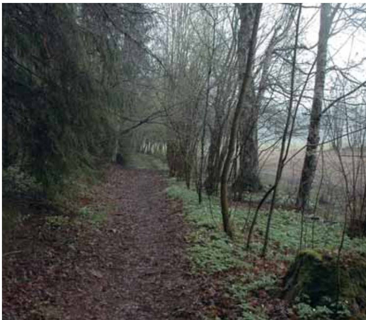
Tursti på Tanumplatået, ett av NOAs forslag til utvidele av Markagrensa.

I forbindelse med den annonserte gjennomgangen av Markagrensa har noe spilt inn tolv forslag til utvidelser: