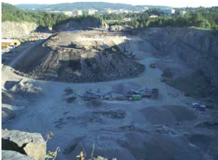
Her har pukverket tatt seg godt til rette i Lillomarka. Utsyn mot Groruddalen og Østmarka.

Aksjonsgruppa har ikke sittet med hendene i fanget og ventet på neste trekk fra motparten, men i stor grad vært proaktiv og offensiv, ikke minst ved å gjøre egne undersøkelser, sende klager og brev til diverse myndigheter,