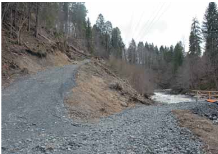
Parti fra Lysakerelven i dag.

De andre hensynene har også sine lovverk, men da gjelder det vanligvis spesielt verneverdige