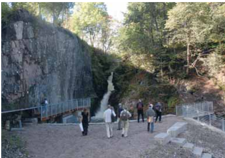
Fjellsikring, stål og betong ved Leirfossen.

Vi må sørge for at ”interesser som ikke er i stand til å delta direkte” eller sagt med andre ord Naturen , får sin rettmessige plass i planlegging og prosjektering.