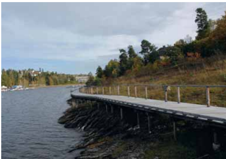
Turvei-”brygge” i strandsonen i Holtekilen.

lokaliteter av nasjonal eller internasjonal interesse. I turveisaker er det ofte mer snakk om å bevare naturopplevelse og uberørthet blant annet for de som kanskje har brukt områdene før turveien ble anlagt. Det betyr at natur- og friluftsforslagene i større grad må minne myndighetene på § 5-1 i plan- og bygningsloven: