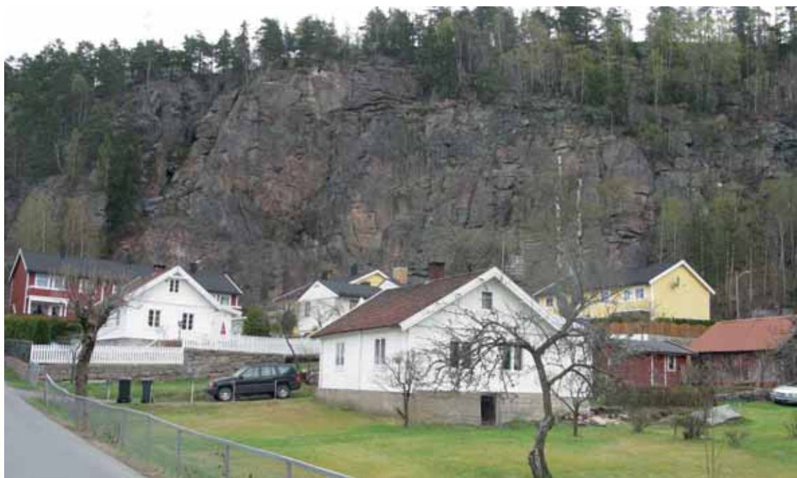
Slik så Hagaløkka med Ravnkollveggen ut en gang.

I forbindelse med omfattende parkmessig oppgradering av turvei D9 langs Alnaelva fra Øvre Grorud og ned til Høla-løkka er også Leirfossen prisverdig langt på vei kommet frem i dagen igjen. Også i Leirfossjuvet er det en stupbratt fjellvegg. Fra et utsiktspunkt i front av fossen ville denne fjellveggen være en flott naturlig kontrast til all betongen i anlegget. Men nei. Trolig fikk man kalde føtter fordi man anla en passasje rett under fjellveggen– steinsprangnett var nødvendig. Passasjen var vel da unødvendig. Vakkert er det ikke, som dere ser av Tom Ekelis artikkel. Red.