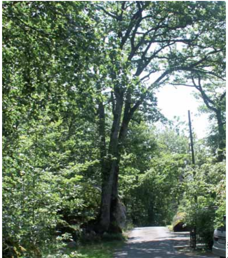
Eika i all sin prakt.

Her er forløpet slik det deretter utviklet seg kronologisk: 3. juli 2011