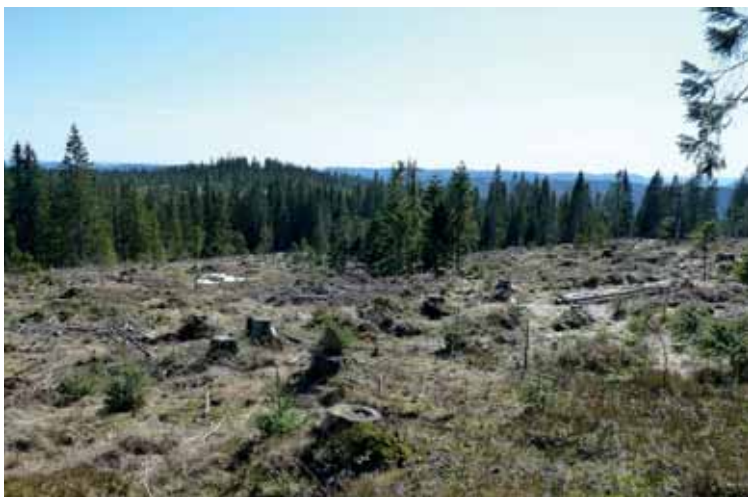
Flatehogst ved Øskjevallsbrenna.