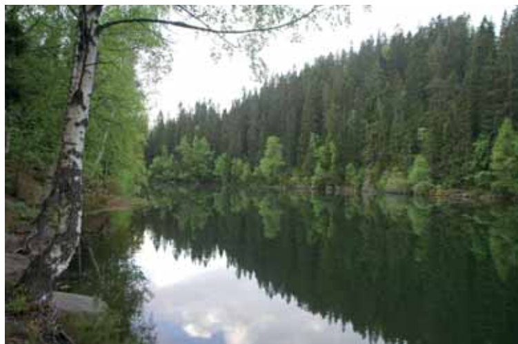
Trollvann – vår nærmeste eventyrskog.

For en vanlig leser vil Markafor-skriften slik den foreligger, se ut som et godt verktøy for friluftsliv og naturvern. Men det er to vesentlige begrensninger som gjør at skogbruket i Marka faktisk drives hardere enn i resten av landet: Reglene er utformet slik at de krever tolkning – og tolkningen er forbeholdt skoglaugets menn. Og da blir det alltid umulig å innfri friluftslivets ønsker. Det finnes alltid en forstlig begrunnelse for å la næringsmessig skogbruk gå foran hensynet til friluftsliv og naturvern. Resultatet etter 35 år med egne forskrifter i Marka er at det