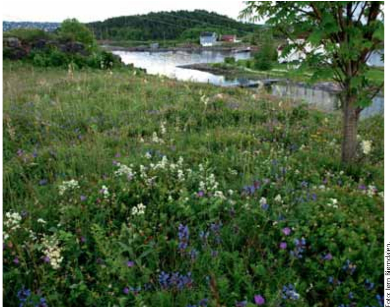
Drakehode er en av de sjeldne artene som nå får sin egen handlingsplan. Arten er kalkkrevende, og finnes i naturtyper som også er viktige generelt for biologisk mangfold slik som kalkberg, kalktørrenger og tørr, kalkrik slåttemark. Bildet er tatt på Heggholmen i Oslo.

Mange av naturtypene skulle vel være velkjente for de som har arbeidet med naturvern en stund og som er kjent med naturen i Oslofjordområdet, for eksempel kalkberg/kalktørrenger, skjellsandenger, varmekjære kantkratt, kalkfurusog, gammel barskog,