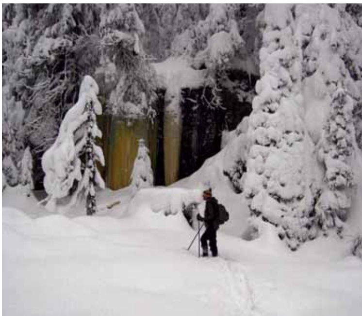
Et vintereventyr på Oppkuven.

• Hvor er det politiske initiativet som ser helheten? Gi grunneierne erstatning for vern etter § 11, hegn om eventyrskogene i Marka, og gi innbyggerne i hovedstaden mulighet for naturbetinget livskvalitet. Det er god velferd. Grønn velferd.