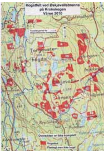
Hogster i det foreslåtte verneområdet på Øskjevallsbrenna 2009–2011