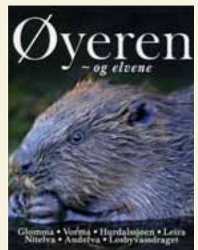
Sverre Solberg og Øystein Søbye Øyeren og elvene KulTurforlaget, Fetsund 2012 266 sider, stort format Innbundet, rikt illustrert

Medutgiver Øystein Søbye står for de aller fleste fotografiene, og utvalget, alle fremragende og enkelte aldeles enestående. Red.