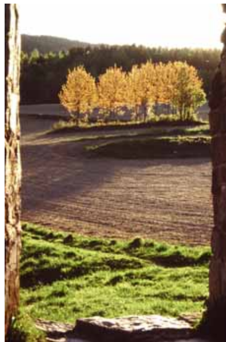
Kulturlandskap i Maridalen sett gjennom kirkeruineene.

Det planlegges også et Tabula gratulatoria, hvor man ved forhåndsbestilling for en høyere pris kan få sitt navn på listen av gratulanter bak i boken! En pen blanding av støtte og hyldest. (Alt nevnt med forbehold, red.anm.)