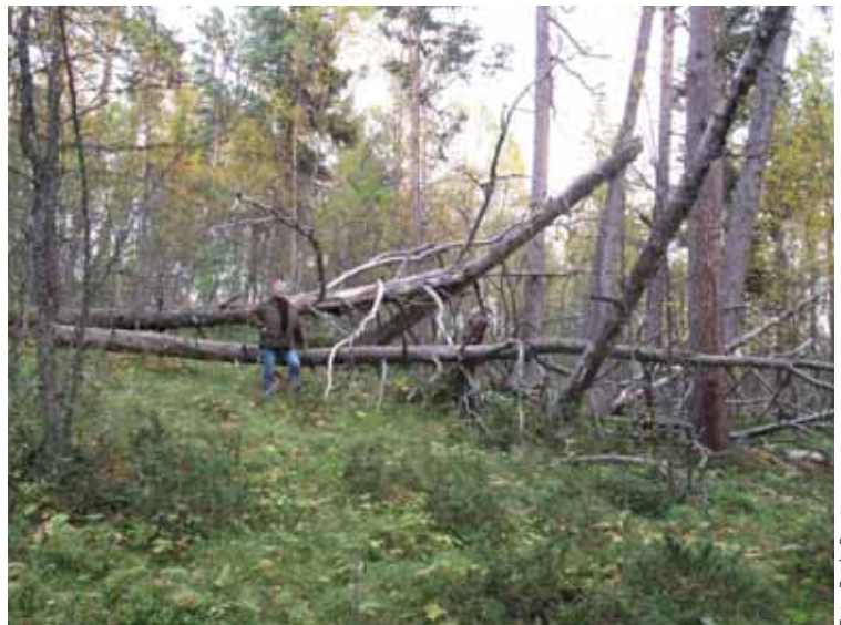
Fra Blessumkalvsveen som ØNV fikk fredet i 1918.