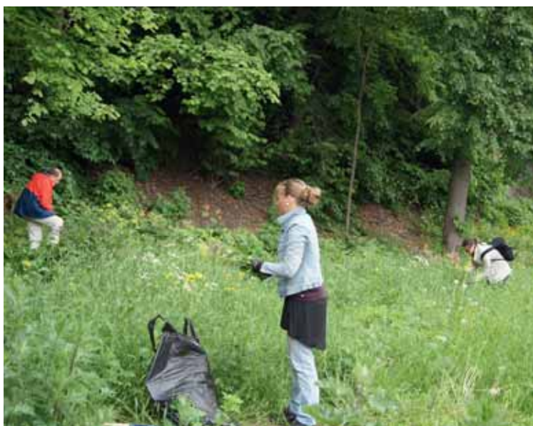
Rydding ved Dronningberget.

Finn praktiske opplysninger om dugnadene på naturvernforbundet.no/noa .