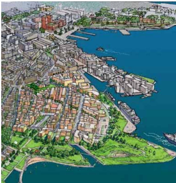
Plansmias forslag – slik kan det bli!

like stor som St.Hanshaugen. Fergekaiene er lagt til sørsiden, slik at utsikten til Bygdøy ikke ødelegges, og fergeterminalen er lagt under bakken. Allikevel har de samme utnyttelsesgrad av området som PBE. Det er mange andre små og store forbedringer som er gjort og som du kan lese alt om på www.fjordbyparken.no . NOV's bidrag til Fjordbyparken har vært økonomisk støtte til tegninger, vi har skrevet avisinnlegg og de kan føre oss opp som en organisasjon de