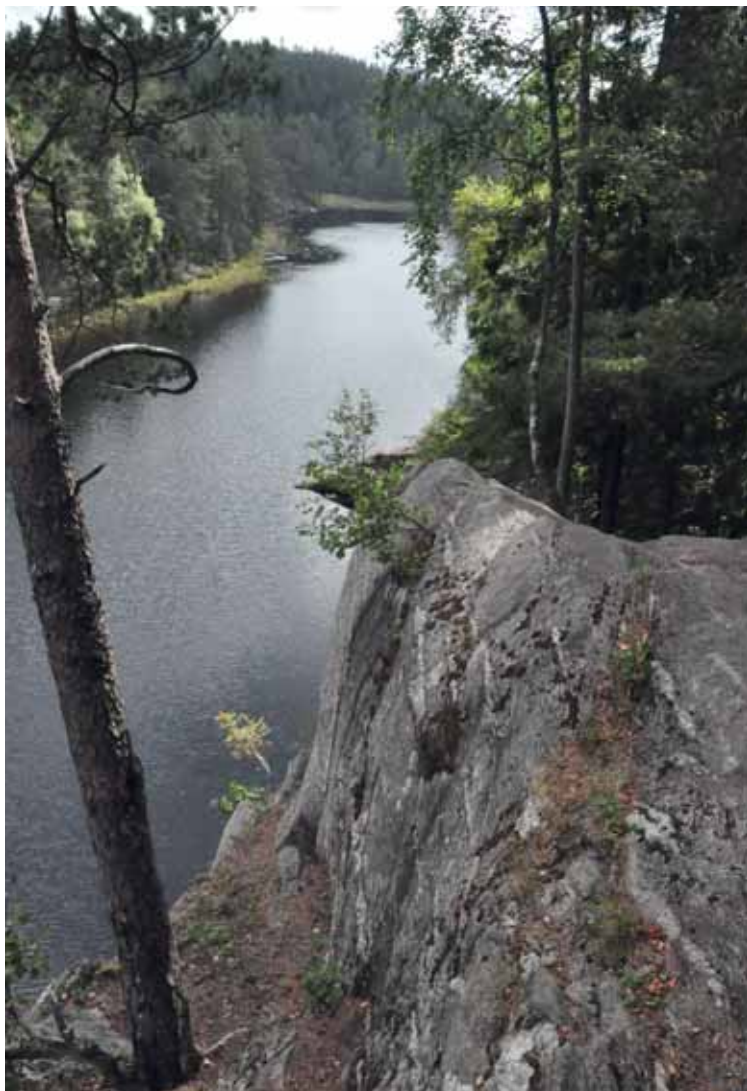
Fra Hauktjern i Østmarka.

Les mer om eventyrskogene på www.noa.no .