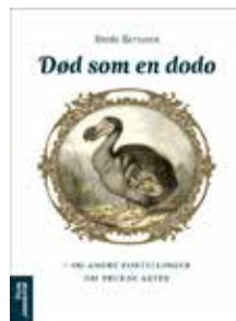
Bredo Berntsen Død som en dodo – og andre fortellinger om truede arter Akademika forlag Oslo 2013 133 sider