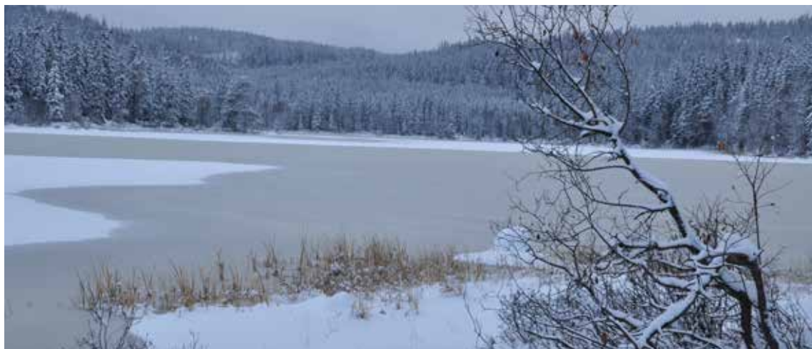
Vinteren er kommet til Spålen.

Som jeg skrev i Grevlingen 3/2013 er det tid for både å pleie vår kontinuitet, samtidig som vi fornyer oss i pakt med tiden og de utfordringene vi møter. Vår utholdenhet og vedvarende press i en del saker gjør at vi med hånden på hjertet kan si at vi har betydd en forskjell. Noen av disse sakene er vi antageligvis nødt til å følge, også i de neste hundre år. Men det må ikke være til hinder for å engasjere oss i nye og aktuelle problemstillinger som følger av samfunnsutviklingen. Prosessen «NOAs syn på...», som styret har startet, er tenkt som en oppstart på nye fagområder, og det er vårt håp at du som leser dette skal engasjere deg i denne prosessen, eller i andre sider av foreningens virke. For det er vårt viktigste kjennetegn: Vi er en idealistisk forening, der det er de aktives innsats og interesser som avgjør hvem vi er og hvordan vi agerer. Frivilligheten utgjør en tredje sektor i samfunnet, som både skal konfrontere næringslivet og forvaltningen med våre utfordringer. Slik er NOAs stemme en del av demokratiet, av meningsbrytningene som i sum bestemmer samfunnsutviklingen i årene som kommer. NOA trengs, også de neste hundre år!