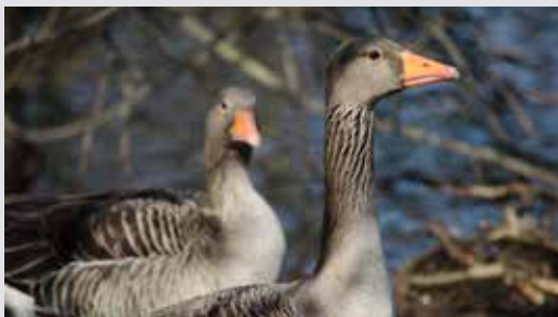
Grågås ved Østensjøvannet.

Oppmøte: kl. 17.30 på P-plassen i sørenden av Østensjøvannet, i Østensjøveien, (Nærmeste T-banestasjon: Bøler).