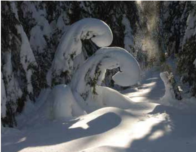
Trollkjerringene bever av frykt for solens stråler på Velohøgda.