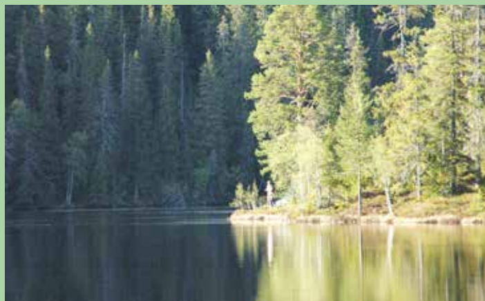
Langvatn i Jevnaker.

Alt du trenger å gjøre er å betale inn ønsket beløp til kontonr: 1280.0502347. Merk gjerne innbetalingen «jubileumsgave».