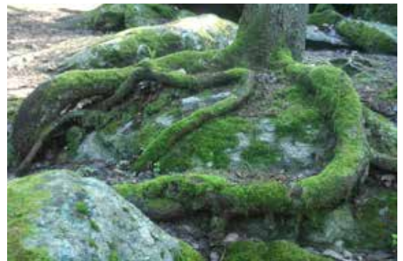
NOAs røtter går dypt!

Alt i alt ble det utført et godt vernearbeid på Østlandet av områdets kretsforening. Da den fylte 25 år i 1939 ble den hyllet av Landsforbundet for naturfredning i Norge (som tok dette navnet i 1938), som den kretsforeningen som på mange måter hadde