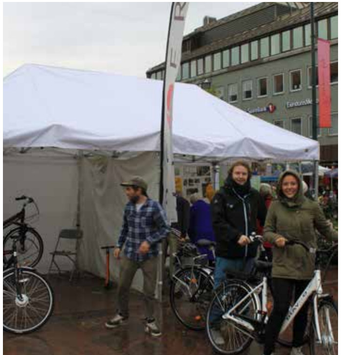
Prøvekjøringen i Bergen.

Syssel kan gi mer forutsigbar reisetid og en betydelig helsegevinst, men