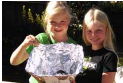
Miljøagentene brukte solovner til matlagingen på arrangementet.

Det er lett å tenke at siden det ikke er så