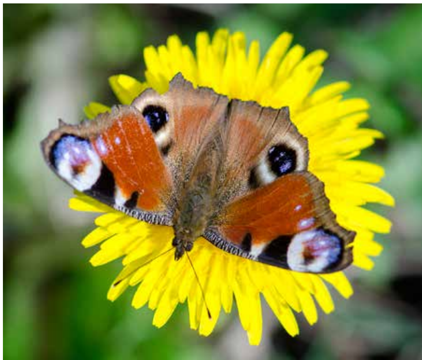
Brennesle-bladene er viktig for sommerfuglen dagpåfugløyve. Her er den på en svele.

Visste du forresten at praktkåpe må ha ospeskog, at admiralen er trekkfugl og at oransje gullvinger er et deilig skue når de danser om gullris-blomstene i solskinet?