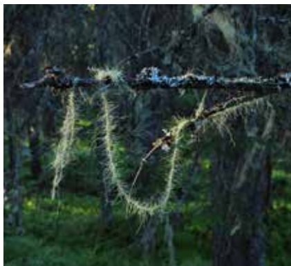
Huldresty, en art som bare vokser på steder med kontinuerlig, lysåpen, gammel skog med stor luftfuktighet. Kanskje får den brukbare livsforhold i Lillomarka?