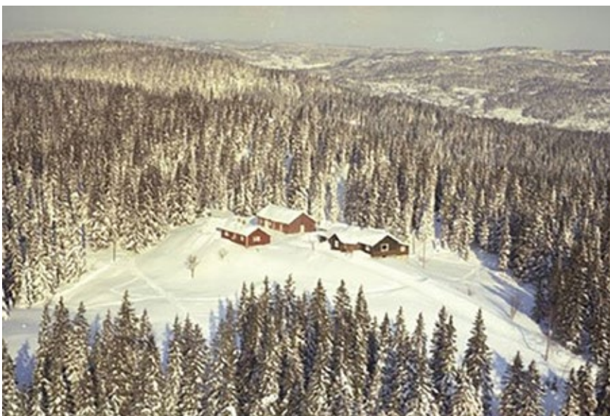
HISTORISK FLYFOTO: Frønsvollen i vakkert snødekke.