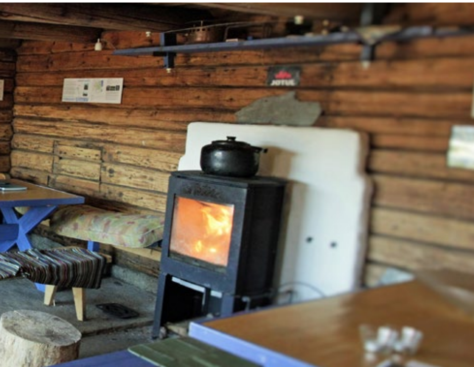
VIKTIGE SEIRE: en møteplass der NOA for vist hvem vi er.