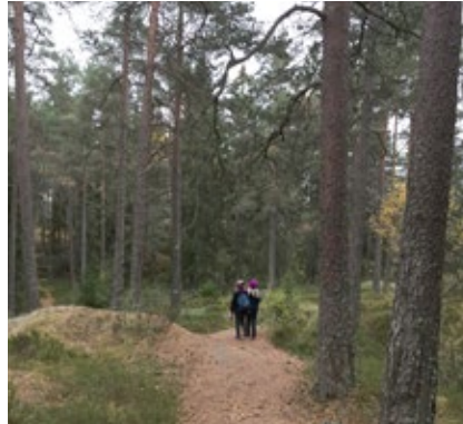
Sti mot Hauktjern.

Det var en variert tur som viste fram noen av de flotte turopplevelsene Østmarka har å by på i det som er Hauktjern friluftsområde. Området ble vernet som friluftsområde etter Markaloven i oktober 2013 etter initiativ fra Østmarkas venner og Naturvernforbundet i Oslo og Akershus. Det er verdien området har for turopplevelse og