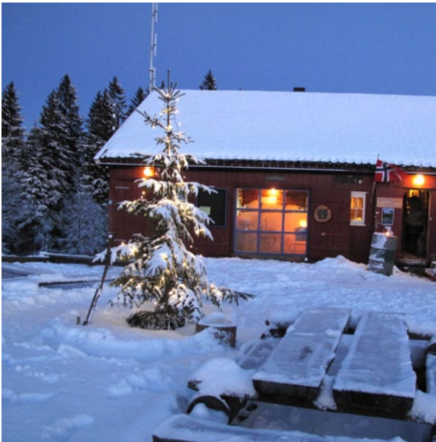
Vinteridyll på Frønsvollen.

En helg på Frønsvollen. Frønsvollen har en glimrende plassering 2 km inn i Nordmarka fra Frognerseteren. Det er unikt utgangspunkt for skiturer i Nordmarka, og en hyggelig hytte å overnatte i mellom turene. Det finnes også akebrett og kjelker på hytta, dersom man har med barn (store og små) som er lei av å gå på ski.