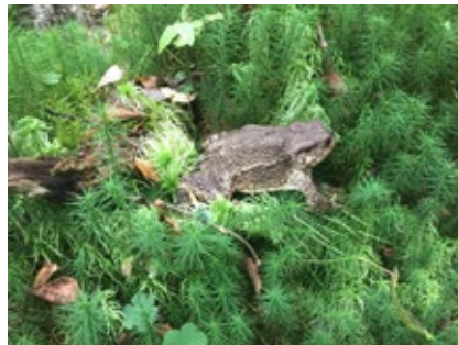
Bål ved Krokktjern.