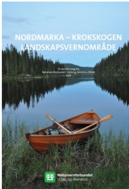
Bildet av den gamle robåten i Nautsundet på Spålen kan symbolisere alle landskapsvernområdets verdier: natur, kultur, friluftsliv og landskap.

Mens området må ansees som godt undersøkt med sikte på natur- og friluftslivsverdier, er dokumentasjonen av kulturverdier dårlig – til tross for alle Markabøkene som er gitt ut. Arbeidet har avdekket et stort behov for kartlegging og dokumentasjon av Markas kulturverdier.