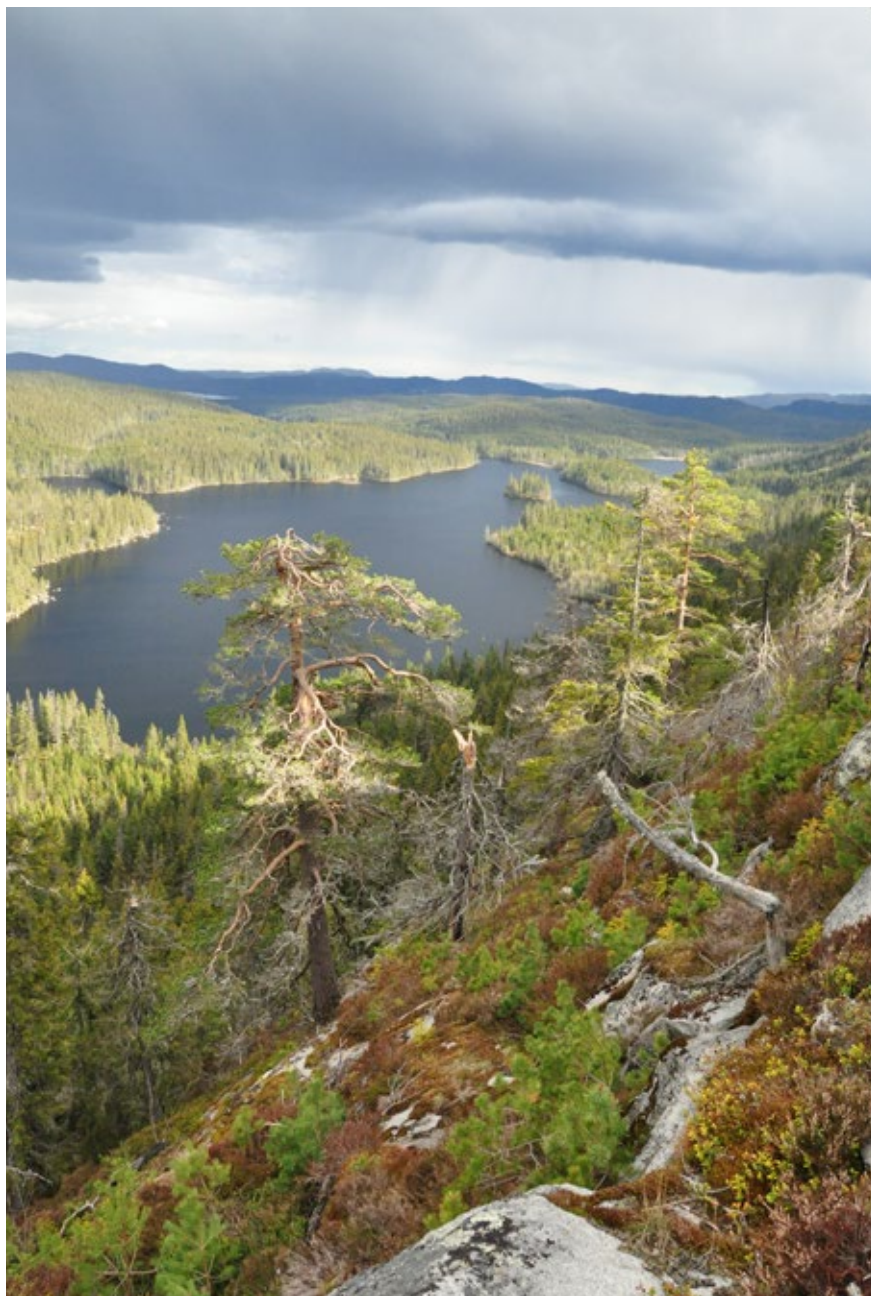
Spålen-Katnosa NR er det største reservatet i Marka. Her sett fra Pershusfjell.

skogstruktur vil vi få tømmer med betydelig bedre kvalitet enn tømmeret fra de hurtigvoksende industriskogene. Produksjon av slikt tømmer kan være en verdifull nisje for norsk skogbruk – i en verden som flommer over av billig industrivirke.