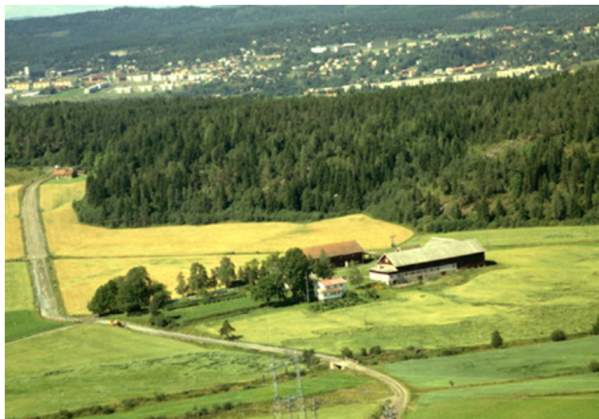
Det var en gang ... Grønne åkre langs Gamle Strømsvei.

Vi passerte villfyllinger og skrotarealer, gamle lagerskur og nyere bedriftsbygg. Underveis hadde vi bl.a. innlegg fra Plan- og bygningsetaten om byutviklingsplaner for de nærmeste ti-årene, der fortetting og kombinasjon næring/bolig er et tema. Deltakerne ble i etterkant bedt om å komme med ideer og forslag. Disse har lagt et grunnlag for mange temaer å følge opp, på