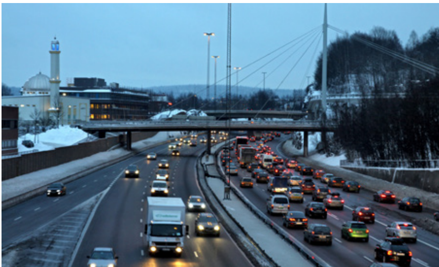
Ikke mer motorvei til Groruddalen.

Naturvernforbundet i Groruddalen støtter høringsuttalelsen fra Ellingsrud velforening, der bl.a. Ahusbanen og tverrforbindelse til Stovner er omtalt. Det må fokuseres på både kortsiktige og langsiktige løsninger. Dagens vei-