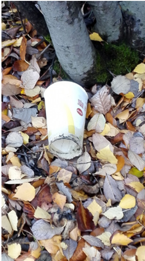
Groruddalen: fra skrot – til spire?.

Les om våre første skritt ut i verden fra starten i 2016 til dagens 3-åring, i en Groruddal der vår visjon er «FRA GRÅTT TIL GRØNT – FRA SKROT TIL SPIRE». Naive optimister? Det sier noen om Greta Thunberg også.