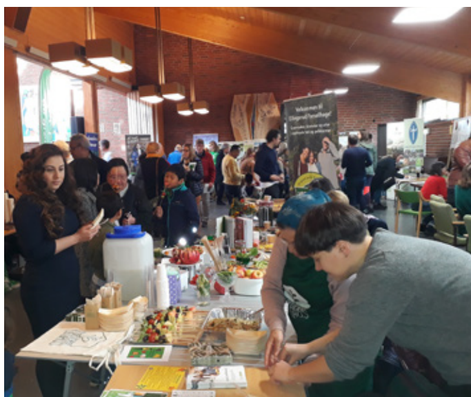
«Grønn festival» fylte hele Ellingsrud kirke.

lokallag. Vårt første arrangement ble kalt «Klimatoppmøte i Groruddalen» og fant sted 17. februar 2017 på Furuset bibliotek og aktivitetssenter. Hele biblioteket var fylt med klima- og miljøengasjement. Mange kontakter ble knyttet under forberedelsene, og disse har vi fortsatt å samarbeide med på ulike nivåer og måter.