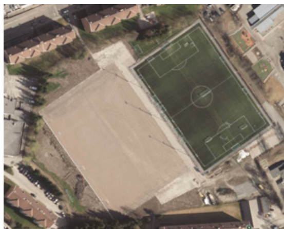
Det store grøntarealet på Kalbakken – nå helt fylt opp av fotballbaner med kunstgress.