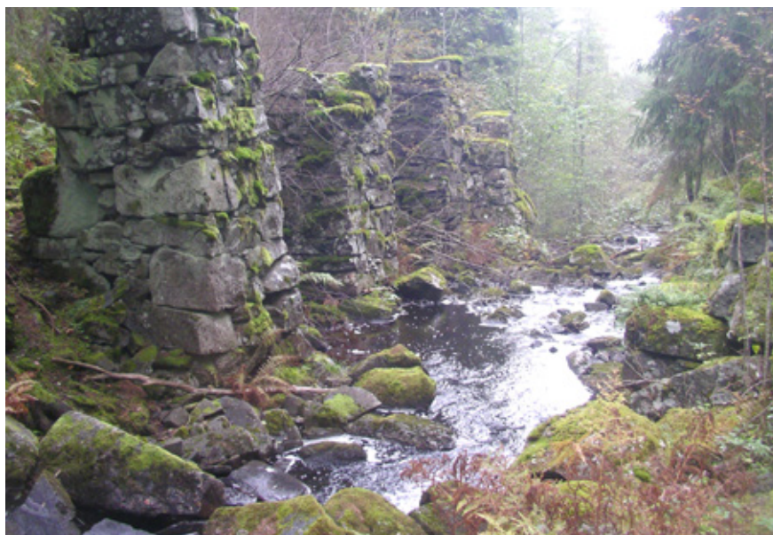
Sagbruksruinene ruver i gjelet ved Mølleåsen. Mange tror de svære ruinene er mølla, men det er etter sagbruk. Sikkert mye stein fra mølla er gjenbrukt her. Mølla lå vegg-i-vegg. Mølla ble bygd i 1795, den var på 4-5 etasjer.

Hvis du går langs Mariholtveien og passerer bommen ved Nuggerud, vil du nå utpå brinken ved traséen til skiløypa få et godt overblikk over mølle- og sagbruksruinene nede ved elva. De kommer fram i dagen med minnene fra hundre års storindustri som ble drevet fra Ellingsrud gård, og tok en slutt i 1860-70-årene. Neste skritt er å rydde den gjengrodde kjerreveien fra Nuggerud-jordene og opp over Mølleåsen og ned igjen til ruinene av mølla og sagbrukene. Turstien kan også godt inkludere ruinene av det like gamle teglverket som ligger litt inn fra elva på Lørenskogsiden, og er ganske bortgjemt i kratt. Den fem-etasjes mølla fra 1795 finnes rekonstruert på papiret. Tenk