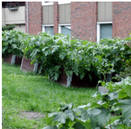
En spirende dal – dyrking mellom blokkene.

Samarbeidsgruppa og lokallaget kan ikke selv gjennomføre alle slike prosjekter. Vi er helt avhengige av å samarbeide med aktører som tar «eierskap» til prosjektene. Vår rolle blir å dytte i gang, støtte og bistå der vi kan og slik være med å tilrettelegge for gode prosesser i det grønne skiftet lokalt. Vi vil fortsette å bygge nettverk og få med nye grupper i en omstilling «fra grått til grønt» i Groruddalen og vise at et klima- og miljøvennlig liv er morsomt, meningsfylt og bra for egen helse og lommebok. Vi håper dette arbeidet vil ta oss inn i ei bedre framtid, med bedre luft, mindre forbruk, kortreist mat og helsefremmende transportvaner.