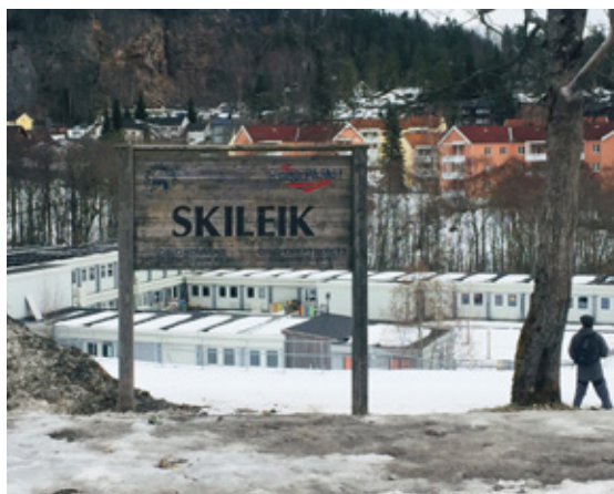
Brakkebarnehagen i Skileikområdet mellom høyblokkene på Ammerud.

Mange kjenner vel friarealer som på kart var registrert som «sikret grøntareale». Noen få år etter var de omgjort til idrettsarenaer eller bebygget med haller. Behovet for undervisningsbygg, barnehager og idrettsanlegg ble tydelig undervurdert i planleggingen av forstedene i Groruddalen, og nå må friarealer og grønne lunger vike. Denne problemstillingen trenger mer årvåkenhet av beboere og politikere på alle plan. Nye boligfelt planlegges tett med for få og for små grøntarealer, trolig for få skoler og barnehager, og for lite plass for idretten. Med bare noen vedtak i kommunestyret, så er det slutt med sikrede grøntarealer - da popper det opp triste firkantede haller og spesialiserte idrettsarenaer i stål og plast, inngjerdet og med asfalterte gangveier – en idrettspark uten gress og trær. Som det sto i planene for idrettslekeplassen(!) ved Furuset Forum: «... den skal stimulere barn til allsidige bevegelser i grønne omgivelser (..) arbeidet med bl.a. legging av kunstgress i aktivitetsparken (!) planlegges».