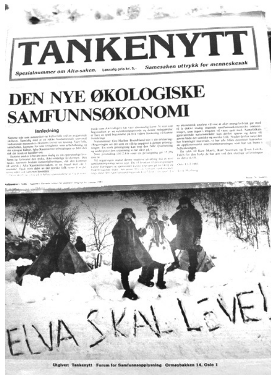
Tankenytt med spesialutgave om Altasaken og en ny økologisk samfunnsøkonomi.