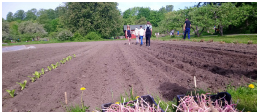
I 2021 dyrket elevene ved Bjølsen skole poteter i Geitmyra skolehage, et prosjekt i samarbeid med NOA, se side 20.