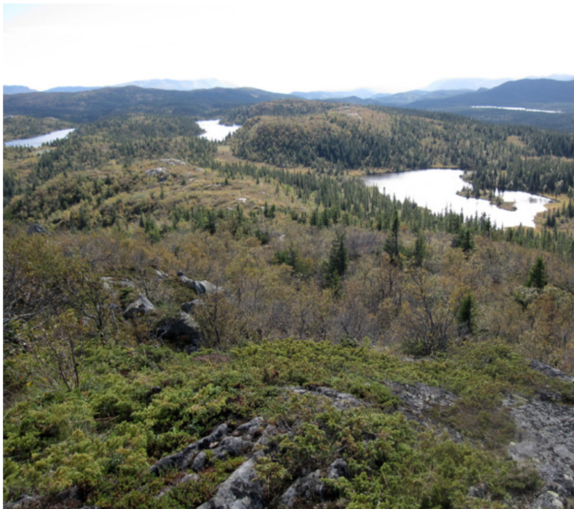
Hvilke kommuner har en bevisst «villmarkspolitikk» og tar vare på sammenhengende natur? Også bevaring av intakte nedbørsfelt er en fremtidsrettet arealpolitikk. Fra Skirvedalen naturreservat, Telemark.

Til slutt: Oppfølging av internasjonale og nasjonale forpliktelser får mening bare når de omsettes i handling. En tenkemåte som her er nevnt, er en forutsetning for å oppfylle våre internasjonale forpliktelser om klima, natur og biomangfold. Men også vår egen grunnlov har et klart budskap om en langsiktig forvaltning av naturen. Grunnloven § 112 omtales gjerne som Grunnlovens miljøbestemmelse . Denne bestemmelsen skal – i moderne språkdrakt – «sikre borgernes rett til et bærekraftig og godt miljø, og pålegger myndighetene å disponere naturressurser på langsiktig og allsidig måte, samt å iverksette tiltak som gjennomfører bestemmelsens grunnsetninger». Mange tiltak etter denne paragrafen vil gjelde måten vi disponerer arealene på. Da er kommunenes evne til langsiktig ivaretagelse av sin naturarv avgjørende.