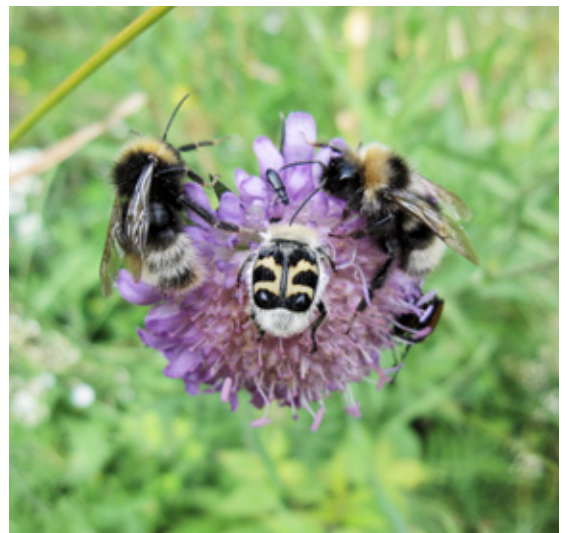
Pollinering er en viktig økosystemtjeneste.

Begrepet naturarv er også velegnet til å løfte bevisstheten om naturverdiene. Mange kommuner er stolte av sin kulturarv, kanskje i form av bygdetun