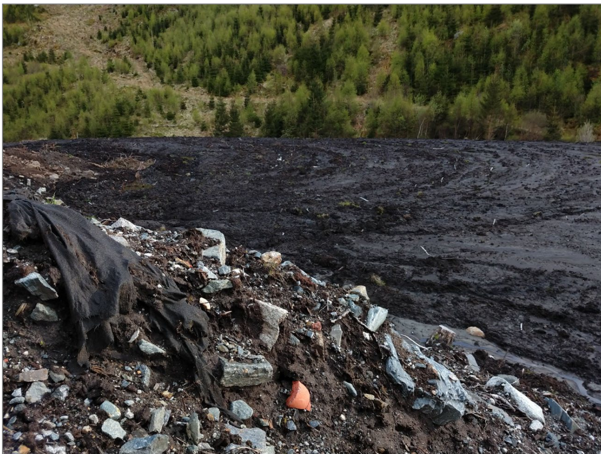
Dette er også fra Gloppemyra. Bilde tatt i mai 2020.