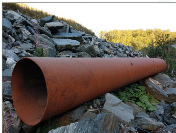
To andre eksempler fra Gloppemyra. Bilde tatt i september 2020.