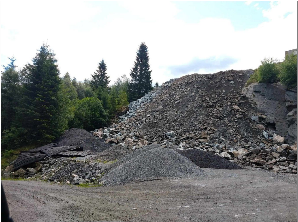
Dette er noe trolig er et privat deponi i Hjellvikvegen.