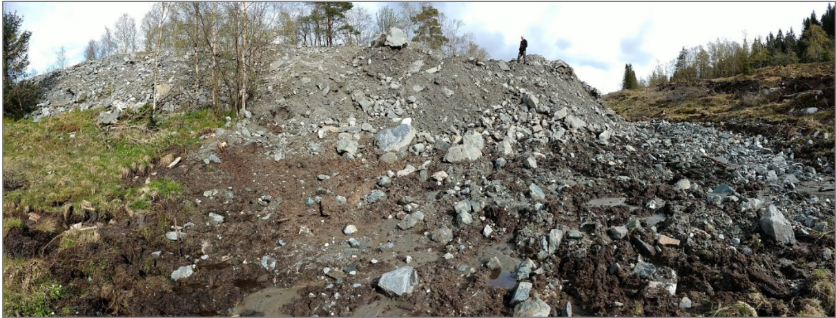
Også fra Rødlandshaugen. Legg merke til mannen oppe i bildet, som viser litt av dimensjonene av skogsbilveianlegget.