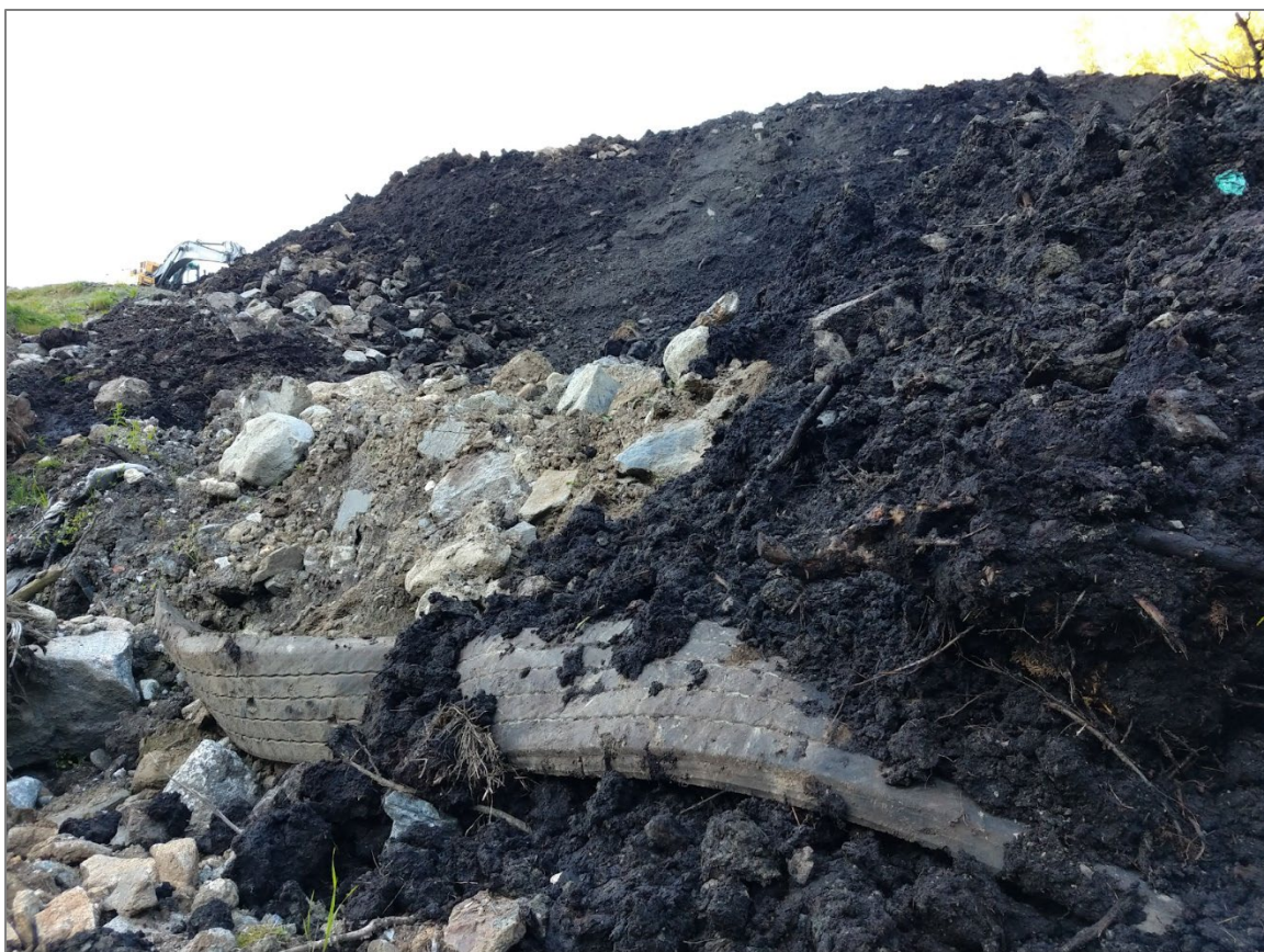
Gloppemyra. Sprengmatter er i ferd med å bli dekket av jord. Bilde tatt i september 2020.