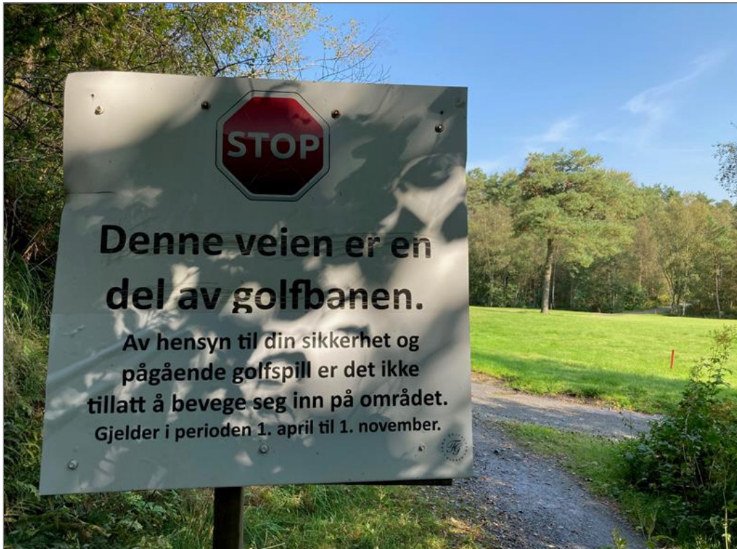
Slik ser skiltingen ved Fana Golfklubb ut. Denne type ferdselsbegrensende tiltak for allmennheten har trolig golfklubben ikke anledning til å gjøre.