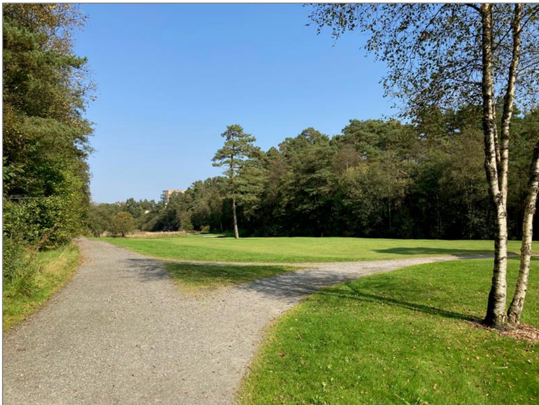
Slik ser de grusede veiene ut langs golfbanen. Det er allmenn ferdsel på disse veien som Fana Golfklubb prøver å forhindre gjennom skiltingen.