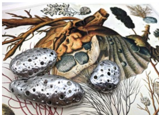
Venstre: Ovula ovum er en sjøsnegle som har gitt form til brosjene Dariusz har laget av søppel hentet opp fra Akerselva. Brosjene er lagd av aluminium og stål, og maling laget av stål og rust av kunstneren selv. Høyre: Fra Cribrum-serien: Brosjer lagd av aluminium og stål.

– Det er det utrolig mye søppel. Jeg fikk dessverre ikke plukket opp alt, siden det er veldig tidkrevende. Området i Akerselva hvor jeg har plukket opp mest søppel går fra pumpehuset ved KHIO-bruen og nedover. Da de bygde nye boliger ble det kastet mye søppel som byggematerialer og større konstruksjoner i elva, og det ligger fremdeles på elvebunnen. Det er utrolig at dette ikke har blitt fjernet tidligere. Siden det var så mange større og uhåndterlige objekter i elven på denne korte strekningen, klarte jeg ikke å rydde opp alt før min mastereksamen slik jeg hadde planlagt. Jeg ønsker derfor å fjerne resten av søppelet langs denne delen av elva etter eksamen.