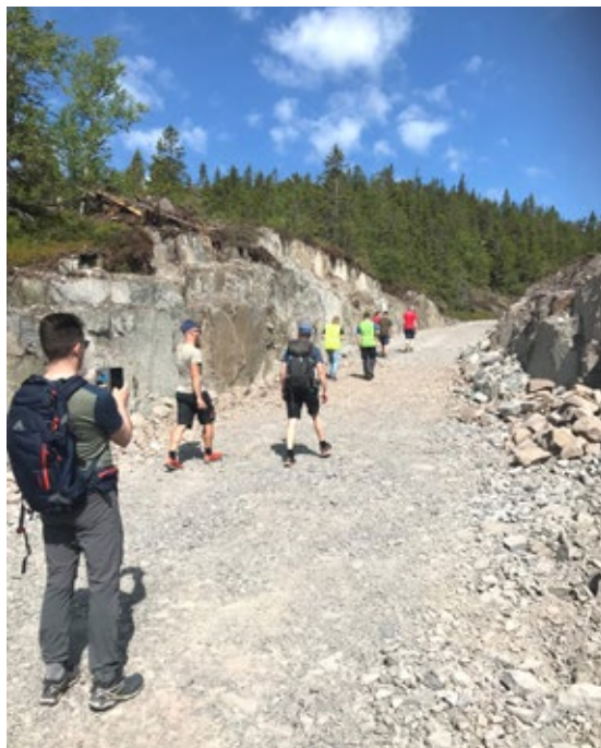
Forsvarets naturødeleggelser på Gyrihaugen er omfattende. De tidligere småkuperte knausene i skiløypetraseen opp mot toppen er omformet til en bred, ensformig og monotont stigende grusvei med skjæringer og fyllinger. Bilde fra befaring med Forsvarsbygg juni 2023.

Da adkomstveien var ferdig bygget og topp-punktet planert ut sommeren 2023 – med omfattende naturødeleggelser som konsekvens – meddelte Forsvarsbygg at Gyrihaugen likevel ikke