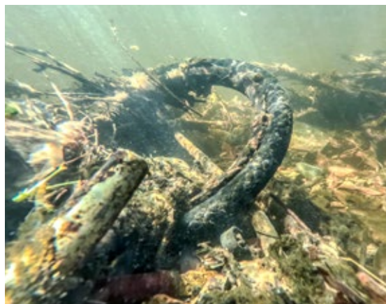
Akerselva er vakker å se på, men det er ikke så idyllisk under overflaten.