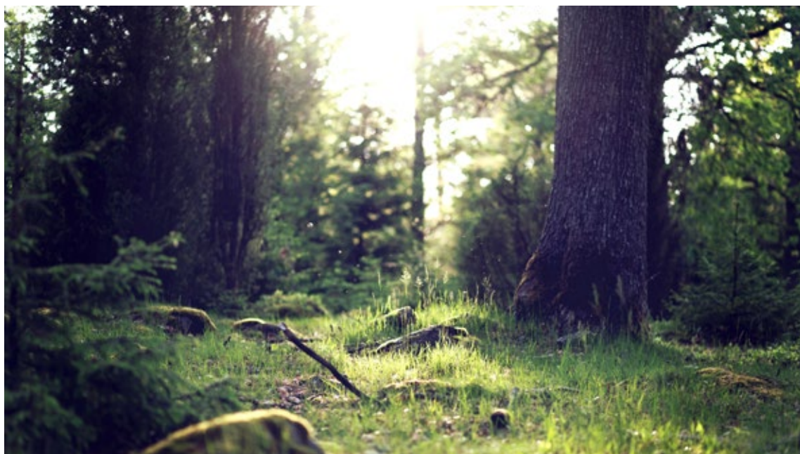
Under pandemien gjenoppdaget folk flest naturen. Nå må vi også lære å ta vare på den.

Fremtiden er ikke noe som bare kommer. Fremtiden kan skapes. I stedet for å fortsette med «business as usual», kan vi vri på rattet og styre mot en grønnere fremtid med nye verdier og nye prioriteringer. Sterke krefter vil motsette seg en slik kursendring. Noen frykter å miste makt, andre er opptatt av kort-siktig fortjeneste. De som har visjoner om et fremtidssamfunn som løser klimakrisen og tar vare på naturens mangfold, møter mye motstand. Makta tviholder gjerne på gammel kurs. Det kreves stor