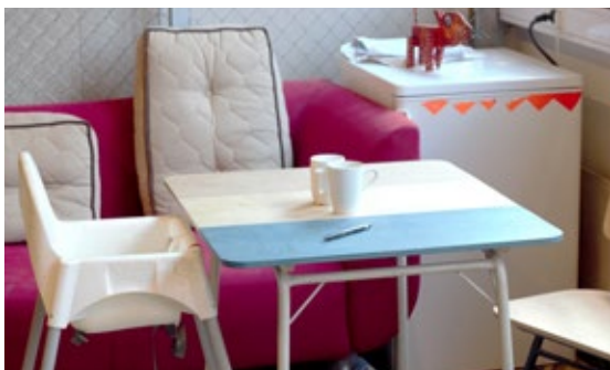
Breiter ønsker å skape en sosial møteplass for folk i nabolaget.

– Utover bare å være et verksted kunne dette stedet vært en fantastisk sosial møteplass. Det ville vært utrolig bra for nabolaget.