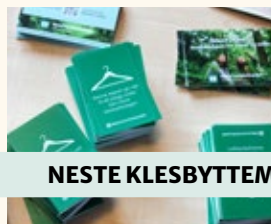
Vårt første klesbytte marked på Søndre Sandås ble en stor suksess.

I april arrangerte vi vårt første klesbytte-marked i våre lokaler på Søndre Sandås. Markedet ble en stor suksess, med flere fornøyde mennesker som kunne dra derfra med nye klær med god samvittighet. I tillegg til klesbytte marked inne i huset, holdt vi sykkelverksted ute på tunet. Her fikk flere reparert sykkel sin god som ny. Vi gleder oss til flere lignende arrangementer i fremtiden!