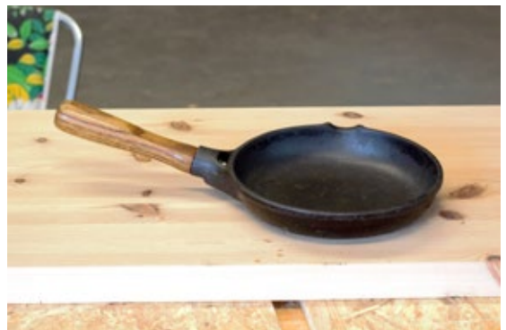
Med nytt håndtak av tre fikk stekepannen leve i flere år til.