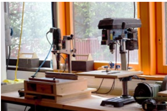
Breiter har satt opp en svær verktøysbenk langs vinduet.

Breiter har store planer for hva verkstedet kan