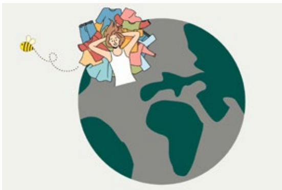
Forbruket vårt er rett og slett ikke bærekraftig. Illustrasjon: Naturvernforbundet.

Og vi nordmenn er i verdenstoppen når det gjelder forbruk. Forbruket til hver av oss krever årlig 33.900 m 2 areal – nesten fem ganger Ullevål Stadion. Til sammenligning klarer en gjennomsnittlig EU-borger seg med under halvparten.