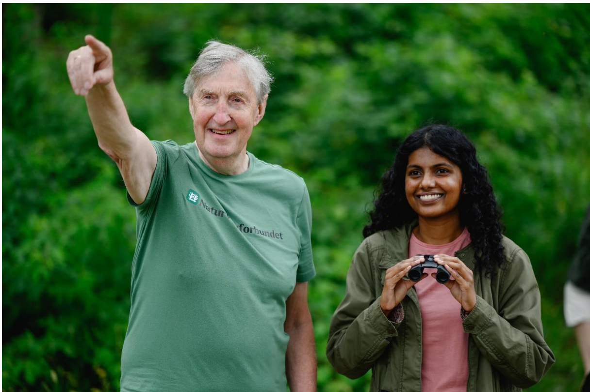
Landsmøte i Naturvernforbundet 2024