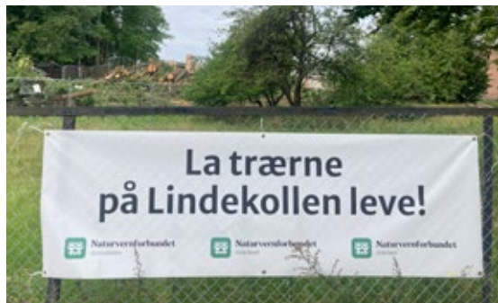
Lokallagene har jobbet hardt for å redde natur og trær på Lindekollen.

Naturvernforbundet Oslo nord, Naturvernforbundet Oslo vest, Naturvernforbundet i Groruddalen, Redd Gaustadskogen, Natur og ungdom Oslo nord, Natur og ungdom Oslo vest, Treets venner, Legenes klimaaksjon, Aktivt rovdryvern, Eco Equality, Berg Nordberg Sogn, Tåsen vel, Gaustadklubben, Rikshospitalets venner, Nasjonal aksjon for bevaring og utvikling av de psykiatriske sykehusene. «Redd Ullevål sykehus» var ikke blant arrangørene, selv om noen frivillige som deltok også er medlemmer i Redd Ullevål sykehus.