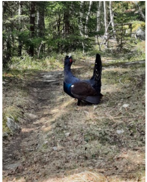
Tatt på den blåmerkede stien ved Dammyrveien.

Lokale politikere i Lørenskog har heldigvis stemt «nei» til skogsbilveien to ganger. Losby Bruk har påklaget vedtaket, og det er nå sendt til Statsforvalteren for endelig avgjørelse. Vi avventer Statsfor-