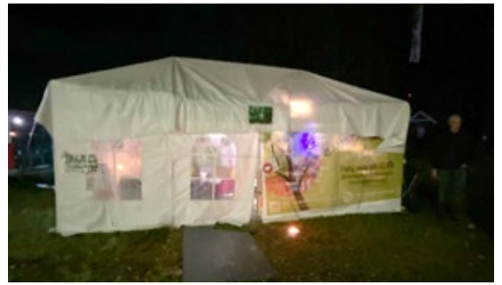
Verne-camp nr. 2 er aksjonistenes base i den videre kampen for trær og natur på Lindekollen og Gaustad.

Verne-camp nr. 2 ble rigget opp 2. september, så den har stått i 9 uker, de første 7 ukene beman- net 24/7, nå med mer ujevne mellomrom. Vi synes den har en verdi, både som samlingspunkt og som en påminnelse for alle som ser den om at det finnes motstand mot ressursløsingen og nedbyggingen av natur på Gaustad.