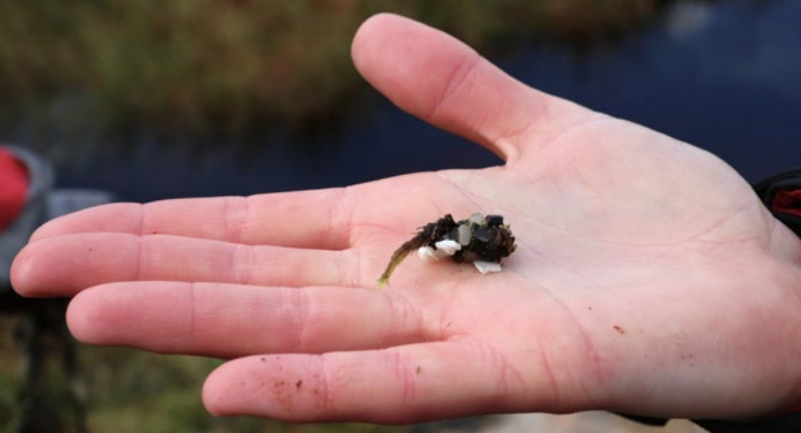
2024: Flere år senere finner vi det igjen; skall fra vårflyelarve bygget hovedsakelig av små plastbiter.