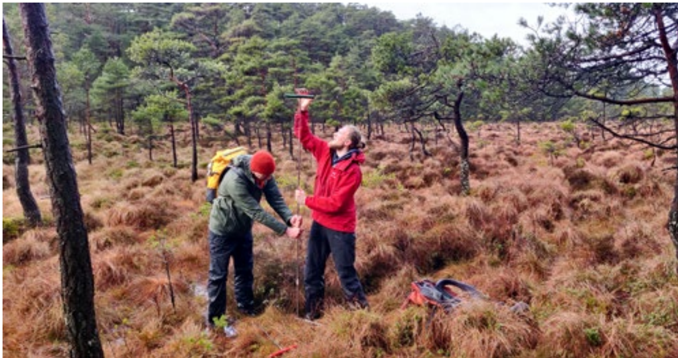
Vi målte myrdybden langs Hordfast-traseen i 2021 for å vise at Statens vegvesen hadde estimert for grunne myrer i sine utregninger. Jo dypere myr, jo mer karbon vil slippe ut dersom myren ødelegges.