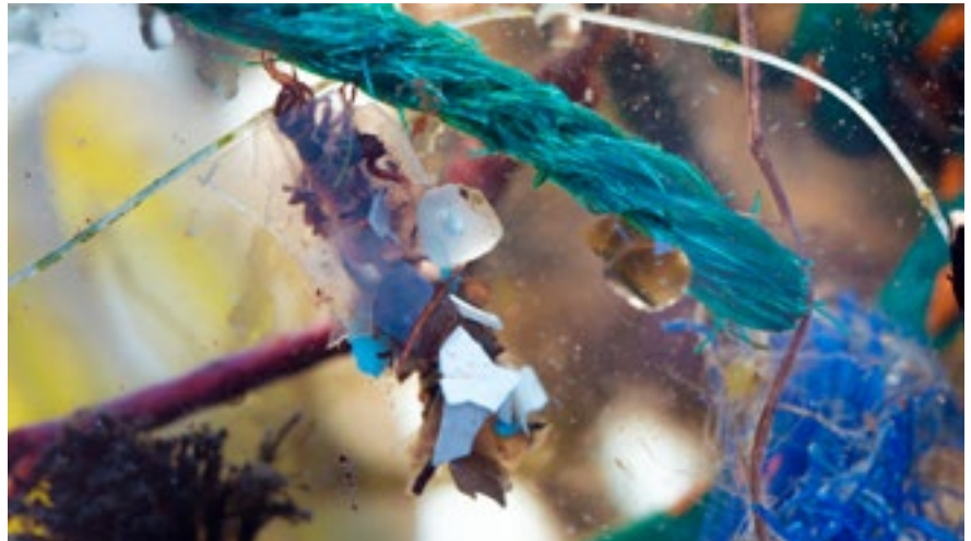
2021: Vårfluelarvene på Lisle Lyngøyna har tilpasset seg et miljø fullt av plast, de kamuflerer seg best ved å bruke plastbiter.

Les forskningsrapporten Rapid Landscape Changes in Plastic Bays Along the Norwegian Coastline . Bare søke på nettet.