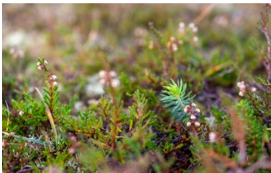
Nå er den liten, men om den får vokse fritt kan den bli 80 meter høy.