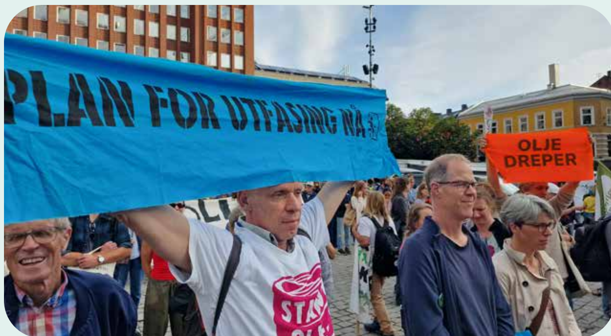
Klimademonstrasjon august 2024.

CO2-avgiften er i dag sammen med klimakvoter blant de viktigste virkemidlene for å kutte klimagassutslippene fra olje- og gasssektoren. Avgiftene er bygget på prinsippet om at «forurensere betaler», hvor en gradvis og årlig økning av CO2-avgiften skal motivere til utslippskutt.