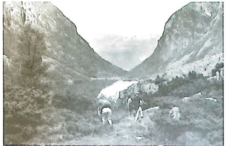
På vei gjennom Bondehusdalen med Bondhusvannet mot Sundal i Mauranger, lørdag 22. august 1987.