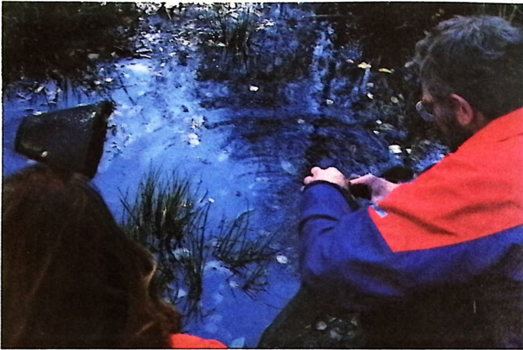
Gamle synder graves fram på Laksevåg.