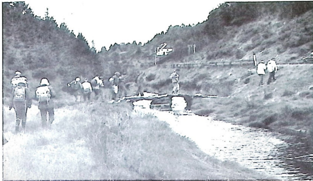
Fra vandringen på den gamle ferdselsvei fra Bontveit over Frotveit, Riple-Totland til Myrdal, søndag 13. september 1987.