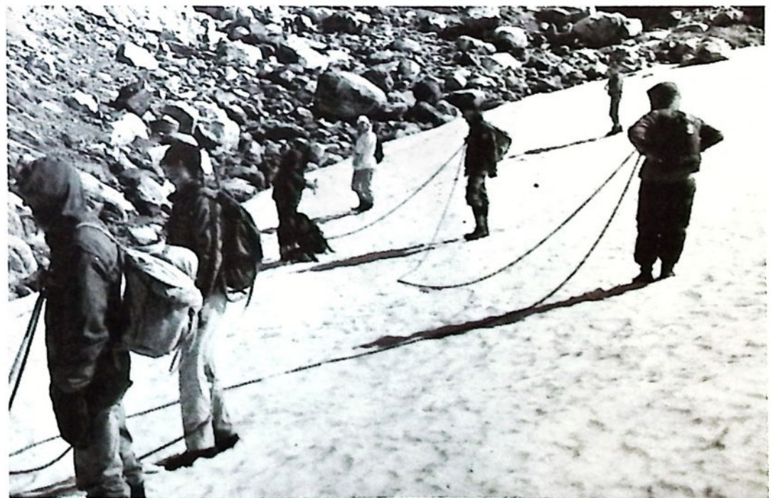
Tauet gjøres klart før opstigningen på nordre Folgefonnen, søndag 23. august 1987.

kjente om turene, og om Vestlandske naturvernforening. Vi burde være mange flere naturvernere!