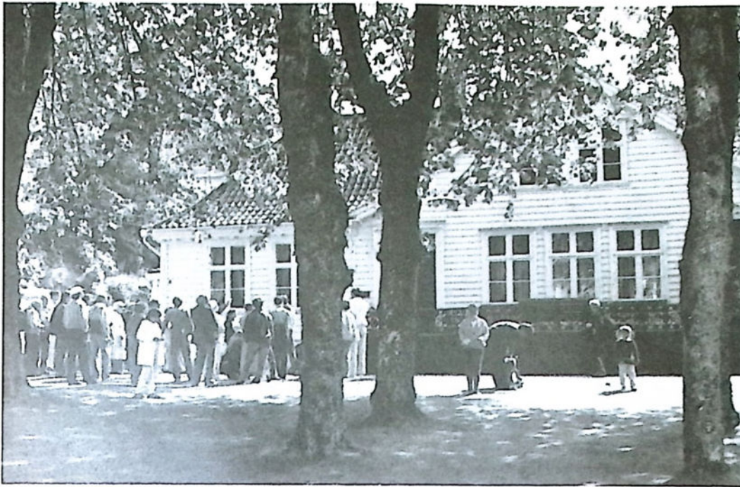
Vandring på Alvøen sammen med Fortidsminneforeningen lørdag 13. juni 1987.

se på landskapsvernområdet og gå tur i Langeskogen, i den nye skogsstien. Forhåpentlig vil den nye skogsstien være bortimot ferdig til juni. Turleder: direktør Anders Kvam, Bergen kommune.