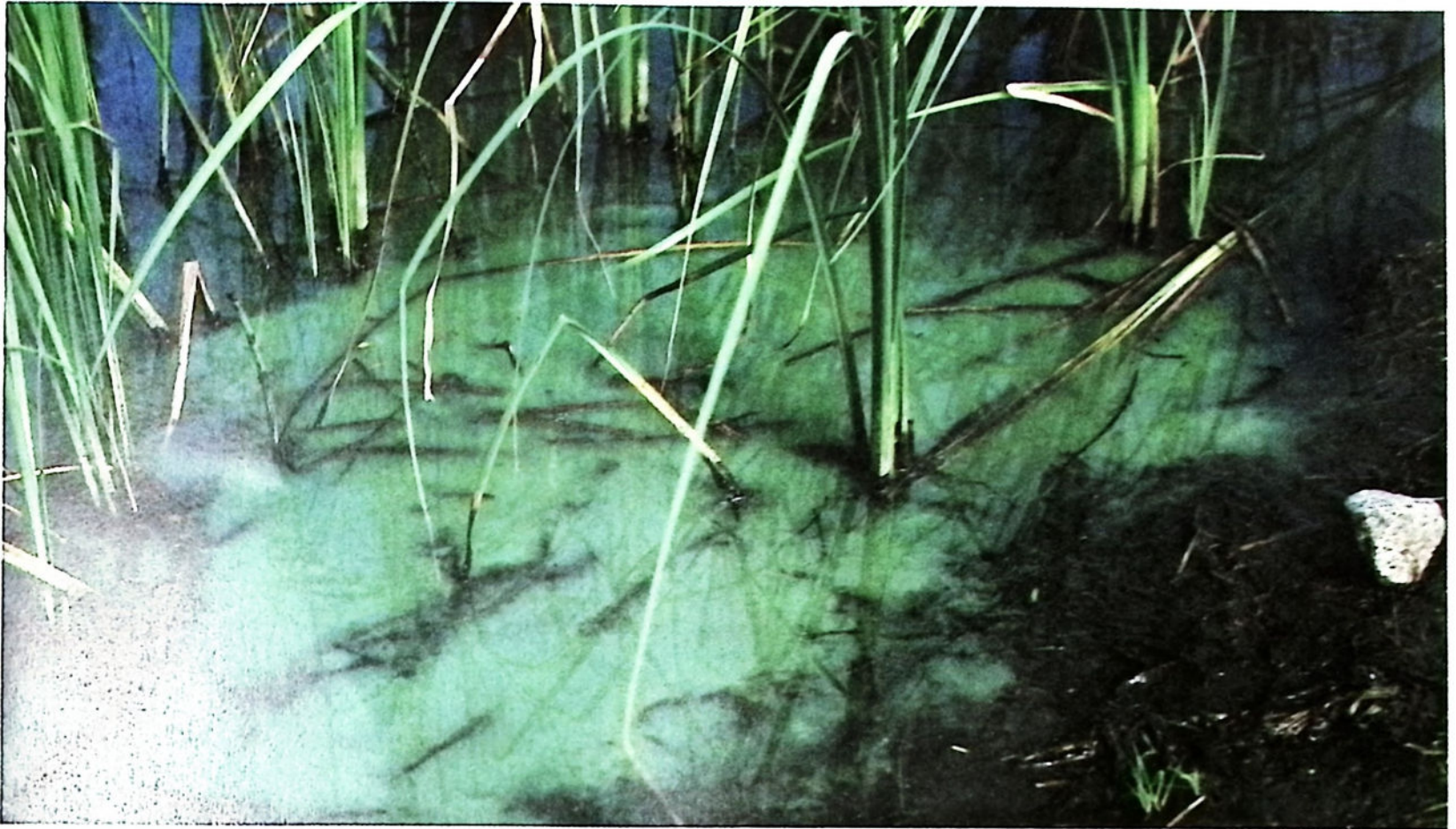
«Algesuppe» – en konsekvens av fosfatutslipp.