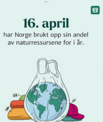
Figur 1. Norges overforbruksdag ble i 2025 beregnet til å være 16. april. Verdens overforbruksdag er 24. juli. Så sent som i 1992 var verdens overforbruksdag 31. oktober.