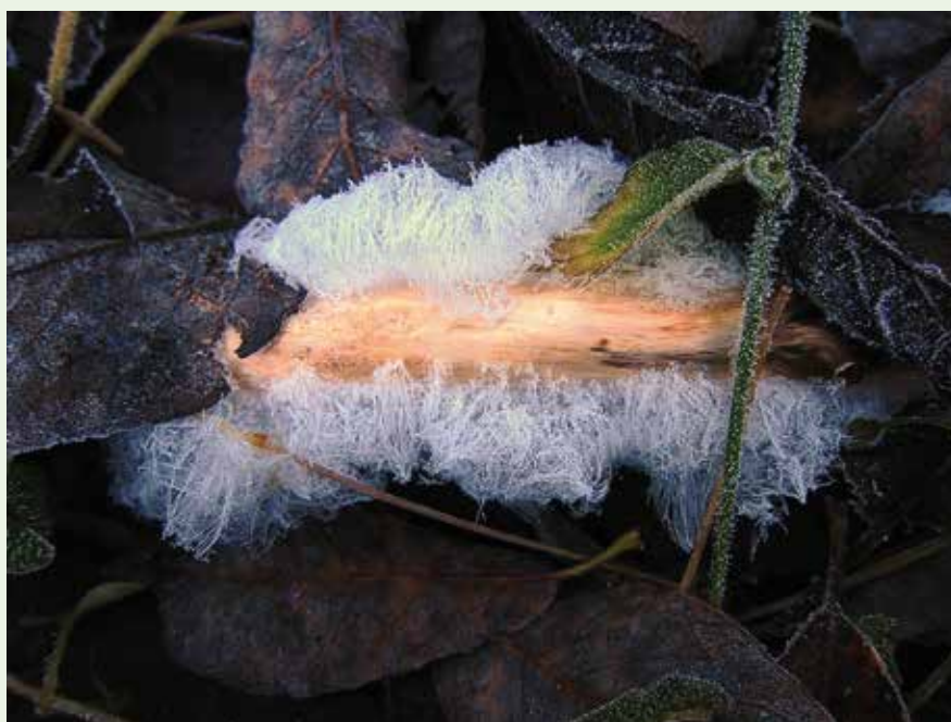
Nisseskjegg. Iskrystallene ser ut som sukkerspinn.

Mer vet jeg ikke, men vakkert er det. Kikk etter nisseskjegg neste gang du går i skogen senhøstes, så kanskje du ser det selv. 🐦