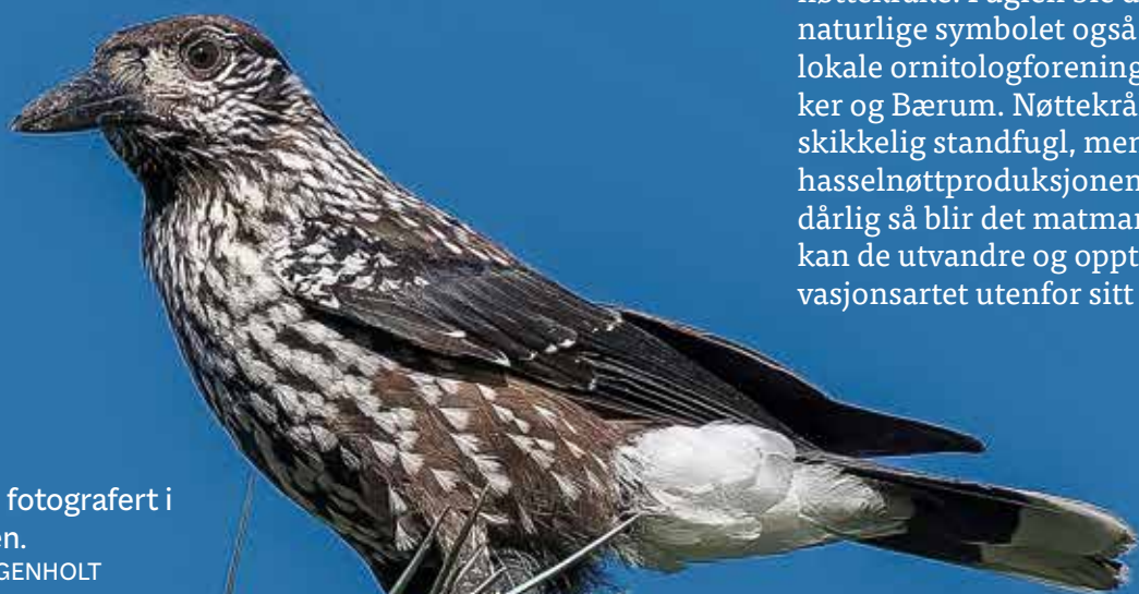
Nøttekråke fotografert i Tøyenparken.

Nøttekråka er svært stedbundet og paret holder trolig sammen livet ut. Et kvistrede bygges høyt oppe i et grantre og ungene føres med hamstrete hasselnøtter fra foregående høst. Dens vanlige utbredelsesområde er i lavlandet vest av Oslofjorden. Asker og Bærum har lenge vært kjent for solid bestand av nøttekråke. Fuglen ble derfor det naturlige symbolet også for den lokale ornitologforeningen i Asker og Bærum. Nøttekråka er en skikkelig standfugl, men dersom hasselnøttproduksjonen har vært dårlig så blir det matmangel. Da kan de utvandre og opptre invasjonsartet utenfor sitt vanlige