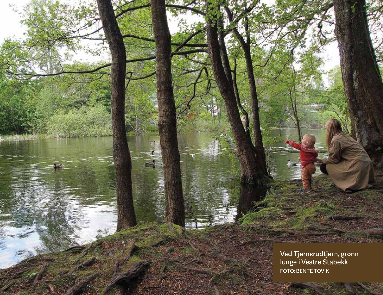
Ved Tjernsrudtjern, grønn lunge i Vestre Stabekk.