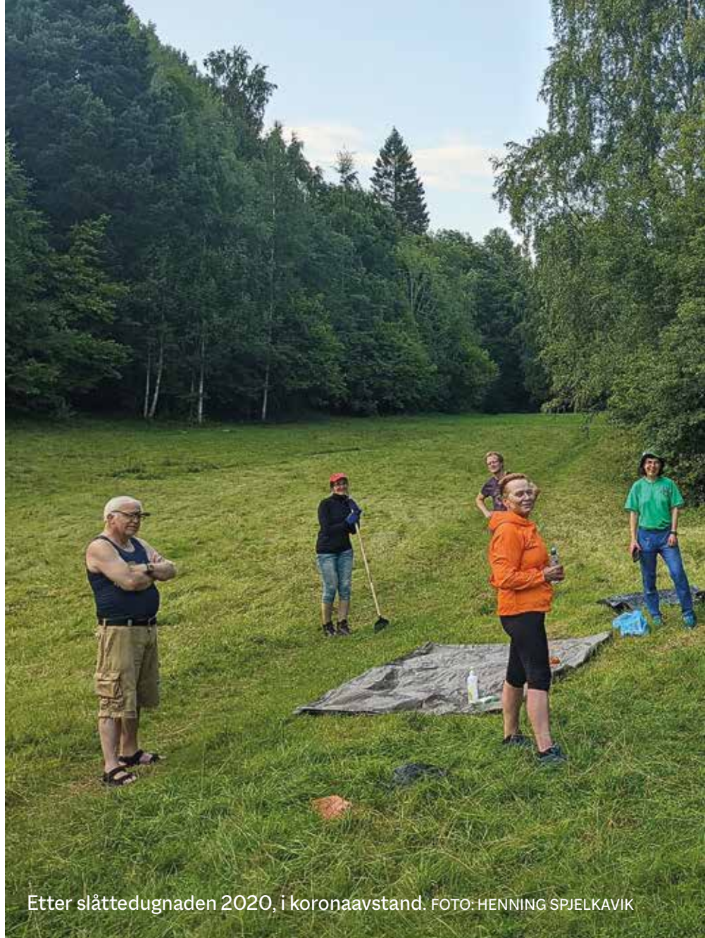
Etter slåttedugnaden 2020, i koronaavstand.

Maskin fikk vi låne av hyggelige naturvenner. Den første tiden hadde vi avtale med Bærum kommune om at vi skulle ta ut