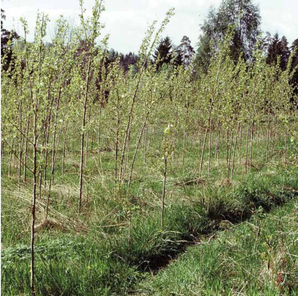
Gjettumbråtan i 1984, delvis gjengrodd.

Reguleringsplanen ble avvist av kommunestyret i juni 1982. I 2015 ble Gardlaushøgda vernet som naturreservat. 🐦