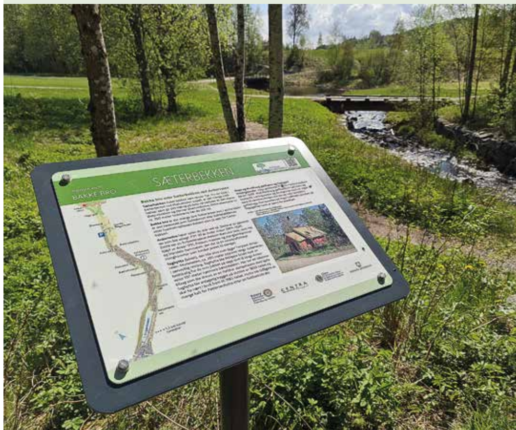
Opplysningsskilt ved Sæterbekken