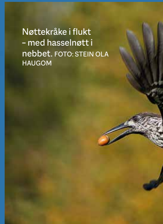
Nøttekråke i flukt – med hasselnøtt i nebbet.

Nøttekråka er en nærings spesialist som bare unntaksvis spiser noe annet enn hasselnøtter og bartrefrø. Det finnes også en sibirsk underart med smalere nebb, som heller har spesialisert seg på de store frøene fra sibirfuru (sembrafuru). Hasselnøttene samler fuglene i en kinnpose som kan romme et snes nøtter. Når kinnposen er full, flyr fuglen strake veien inn i granskogen igjen der den graver nøttene ned innenfor territoriet sitt. I slutten