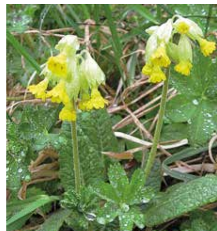
Marianøkleblom blomstrer på Gjettumbråtan i mai. Arten er vurdert som sårbar på norsk rødliste for arter.

Resultatet så langt er at det i 2012 ble funnet totalt 129 plantearter. Til sammenligning ble det funnet 78 plantearter i 2005,