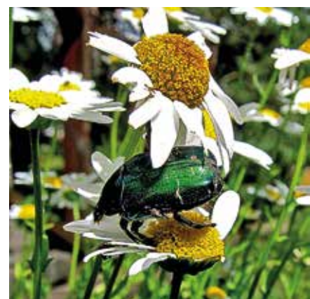
Enga gir liv til insekter. Her gullbasse på prestekrage.

og 64 plantearter i 1998. At det totale antallet plantearter har økt på 15 år, viser at skjøtsel av enga hjelper på det biologiske mangfoldet