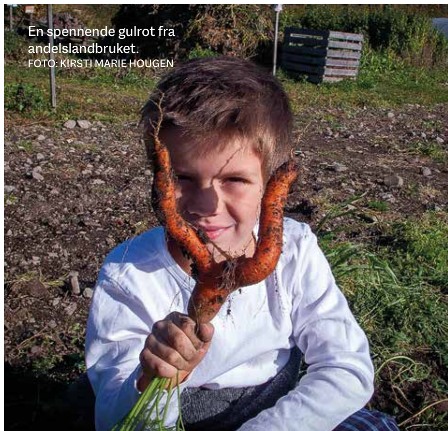
En spennende gulrot fra andelslandbruket.

Som nevnt tidligere hadde Øverland Østre i 1981 planer om alpinanlegg ned fra Gardlaushøgda og på tvers av Ankerveien. Planene ble avvist av kommunen den gangen. I 2015 derimot ble Gardlaushøgda vernet som naturreservat, til stor glede for NiB og Bærums befolkning. Verneprosessen er et resultat av såkalt frivillig vern, hvor grunneierne på Stein gård, Øverland Vestre og Øverland Østre har fått godkjent at området har spesielle natur- og miljøkvaliteter som krever regulering av bruken og dermed utløser erstatning. Det er Statsforvalteren som godkjenner slike naturreservater etter en omfattende prosess og kartlegging. Reservatet er på ca. 575 dekar og er vernet etter naturmangfoldlo-