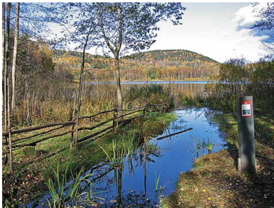
Fra Kolsås-Dælivann.

Kolsåsmassivet i vest og Dælivann-senkningen og Dælskogen i øst ble vernet som landskapsvernområde ved Kongelig resolusjon i 1978. Vi sto ikke bak forslaget om at dette området skulle vernes, men bidro aktivt med å