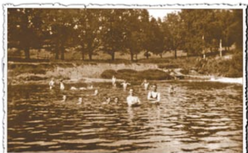
BADELIV I KOLABRUHOLEN

Flomtiltaksplanen for Wøyenenga fra NVE må revideres, eventuelt forkastes, om utviklingen for Isielva og den livsviktige meanderen nedenfor skal overleve. Ellers vil erosjon langsomt og sikkert ta det siste håp om fortsatt liv for anadrom laksefisk og det hele vil snart være en ”saga blott”.