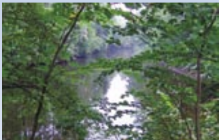
Selv helt nede ved Hamang er Sandvikselva en idyll.