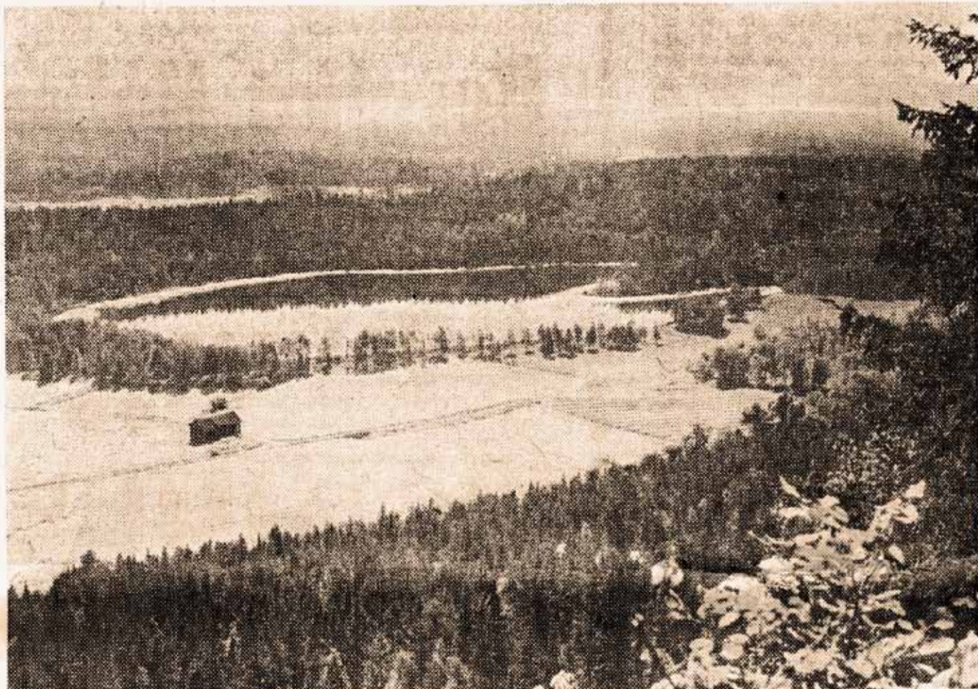
Dælivannet ligger meget vakkert til når man ser det fra toppen av Kolsås.

“Bærum kommune hadde andre planer med Fleskumåsen øst for Dælivann og jordene under Kolsås, og var imot at Kolsås-Dælivann skulle bli et landskapsvernområde”