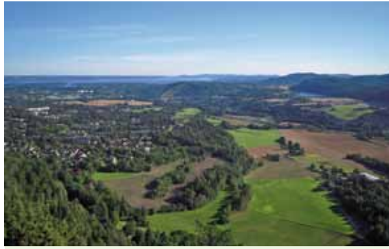
Utsyn mot Eineåsen Stovivannet og Tanum Synliggjør de viktige randsonene mellom Marka og bebyggelsen 134

Jordbru ble ikke bygget ut, heldigvis. Men nå er planene flyttet til Vestmarksetra. Et lite lokalt skiskytteranlegg, oppdemming av en bekk for å kunne produsere kunstsne, større og bedre og flere brede løyper og lysløype – "det er alt". Selv om det altså står i Markaloven at skyteanlegg ikke skal ligge i marka. Snøproduksjonsanlegg er ikke en liten sak, det skal også NVE mene noe om. Svære, nye løypeanlegg er ikke ubetydelige inngrep selv om de knytter seg til de store løypene som allerede er der. Tvert i mot – dette blir stort! Varmestue og toalettforhold og andre nødvendige fasiliteter er ikke nevnt i noen planer så langt. Heller ikke at veien opp er smal og svingete og allerede i dag farlig for gående og syklende. Vinterstid er det enda verre for da er det glatt og bratt. Par-