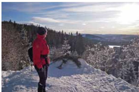
Utsikt fra Tjæregrashøgda en vinterdag

Her er det planer om et regionalt treningsanlegg for ski og skiskyting. Grunneieren vil avgi arealene, Hole kommune vil regulere, samarbeid med Bærum kommune om dette pågår og flere kommuner er interessert. Her er det parkeringsplasser og plass til flere, snøsikkert, skileikanlegg, alle fasiliteter som