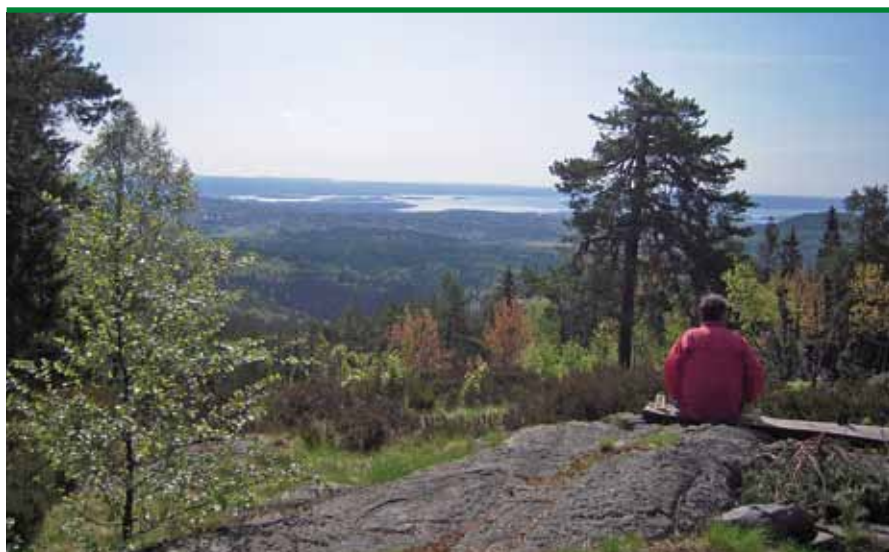
Utsyn fra Brunkollen en sommerdag