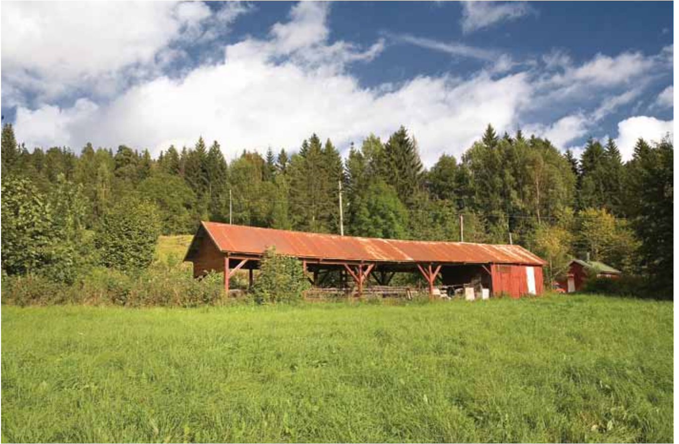
Isi gårdssag.