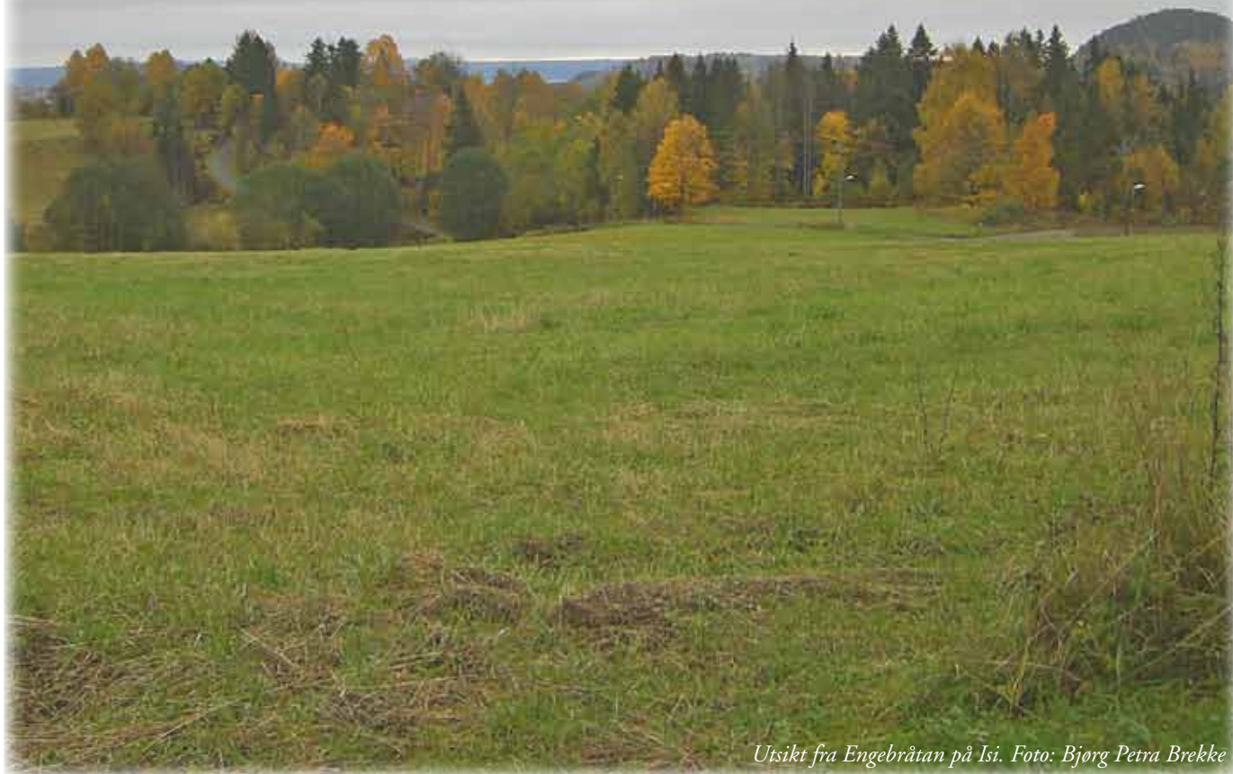
Utsikt fra Engebråtan på Isi.

Hvorvidt Isi gårdssag skal bli vernet, er i siste omgang opp til politikerne. Vi ber tynt!