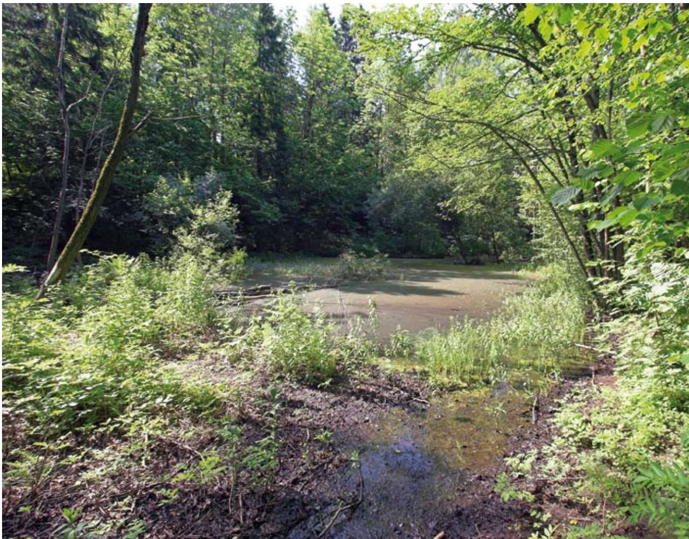
Dam ved Jardarkollen på Slependen med et rikt arts mangfold. Kommunen er i ferd med å regulere dammen og området omkring til spesialområde naturvern.

territoriet, dvs. 12 nautiske mil fra land. Sistnevnte er en svakhet ved loven idet oljeindustrien dermed ikke må forholde seg til regelverket. Loven er dessuten avhengig av at det bevilges midler til kartlegging, registrering, forskning og overvåkning.