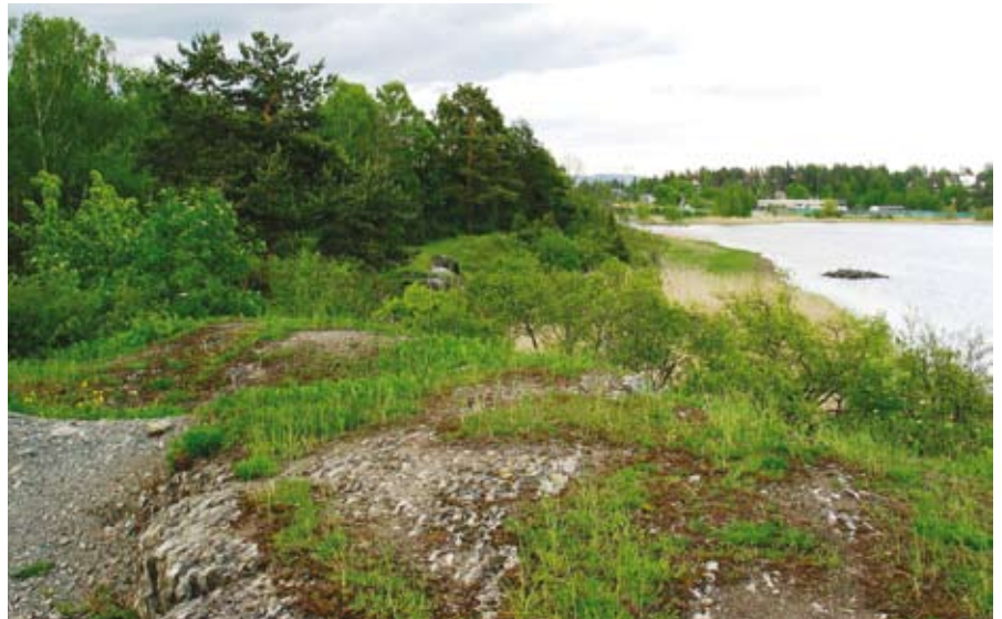
Dette bildet fra Hundsvund viser i forgrunnen de karakteristiske vekslende lagene med kalkstein og mørk skifer. Kystsonen inneholder flere stedeegne plantearter som kommunen har et nasjonalt ansvar for å forvalte riktig.