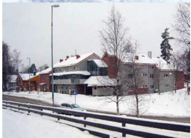
Fra Høvikveien ved Gjønnes. Et grønt pustehull for naboer, forbipasserede og våre fugler fikk ikke lov til å ligge i fred.