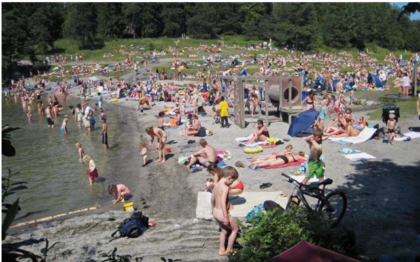
Fra Kalvøya. Bærum har fått en ny stor badestrand ytterst på Storøya, men ellers er det få nye steder å ta i bruk. Snart fullt?