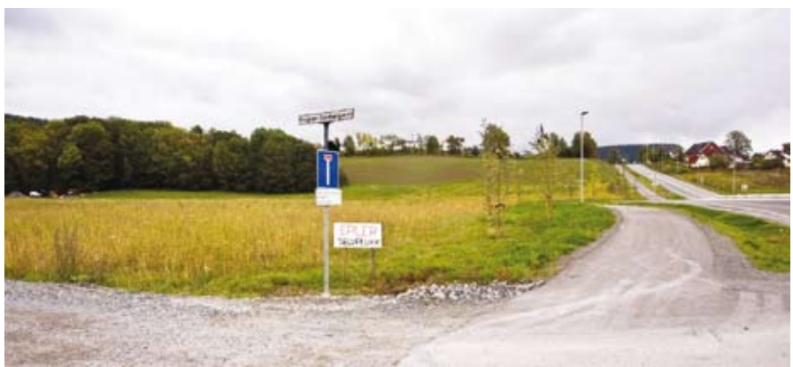
Jordet ved Økrikrysset