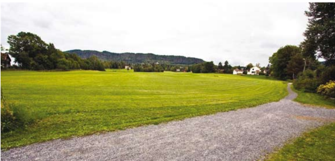
Jordet ved Ulvestuveien