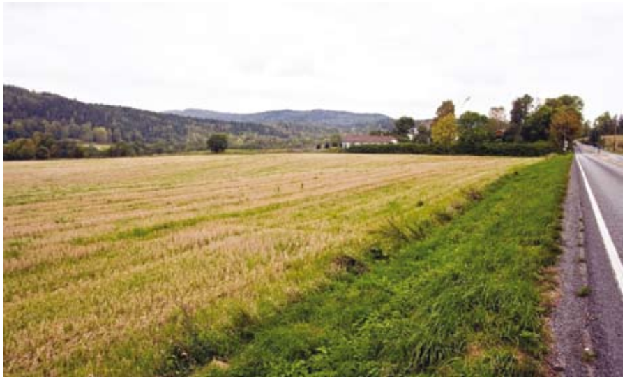
Jordet syd for Nordhaug