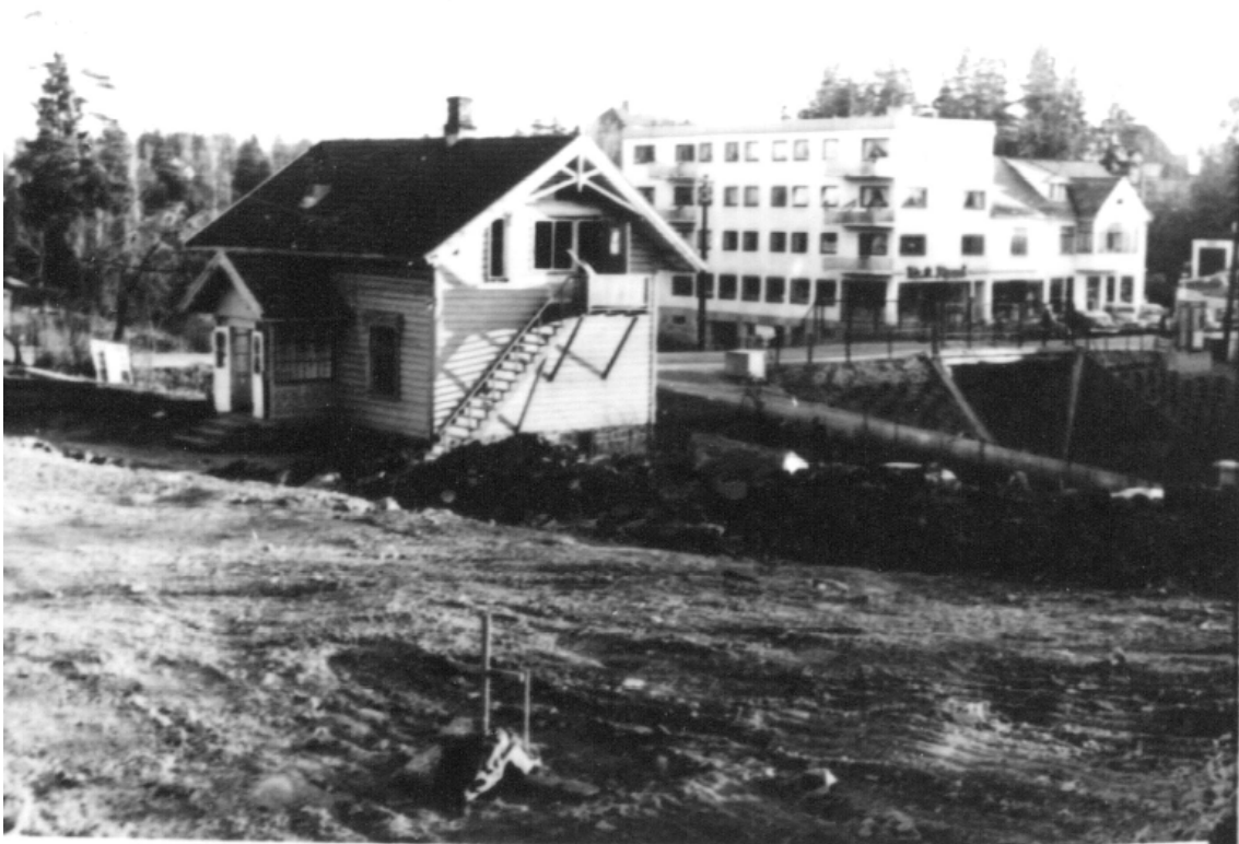
Stendahlhuset. Nic. O. Rud-gården i bakgrunnen (1959)