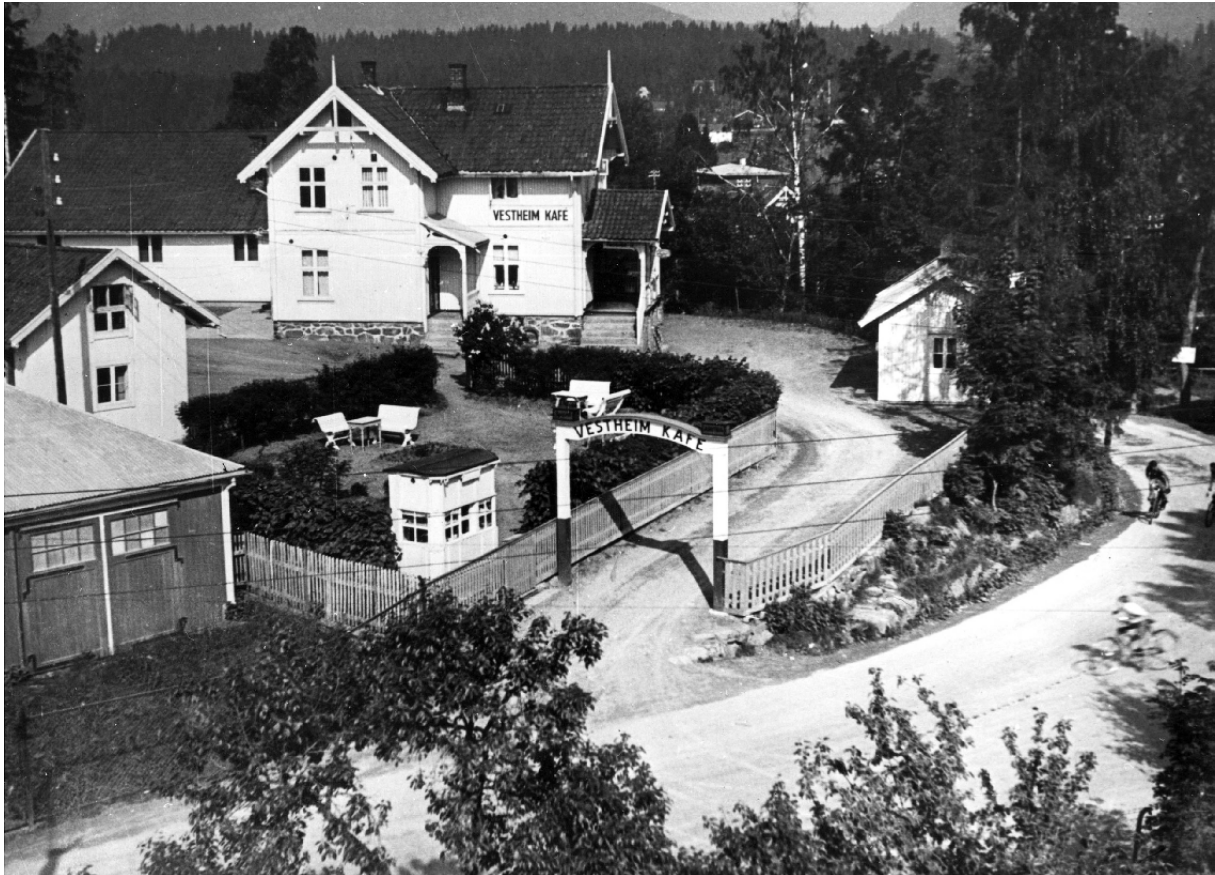
Vestheim kafé med deres kiosk nede ved veien(ca. 1938)