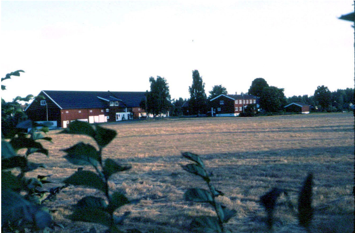
Gjønnes gård (1981)