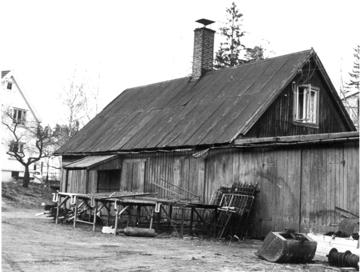
Furu-smia (Foto: J. Jacobsen, 1971)

I Gml. Ringerriksvei litt nedenfor Furuveien holdt Smed Furu til. Hestene på Gjønnes gård ble skodd der. Under krigen var det mange som fikk reparert brukne meier på sparkstøttinger og rattkjelker hos ham.