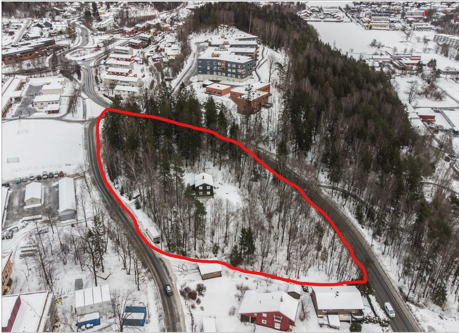
- Den er et av eksemplene på at kommunen, med Høyre i førersetet, bygger ned rødlistet natur, skriver innsenderne om den planlagte utbyggingen av Vallerveien 146, rett ved Gjøttum skole og Lindelia sykehjem.

Maksimalt 3.000 tegn inkludert mellomrom. Legg gjerne ved portrettfoto. Retningslinje: Innlegg må signeres med fullt navn og handle om lokale forhold. Send innlegg til debatt@budstikka.no eller budstikka.no/debatt