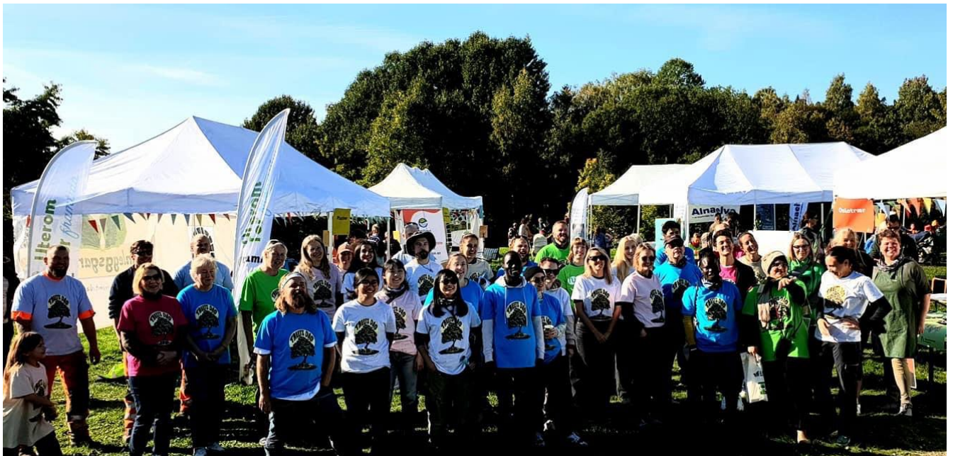
Alle medarrangørene og andre frivillige