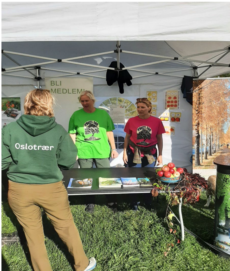
Stand med medlemmer fra Naturvernforbundet og Treetts venner