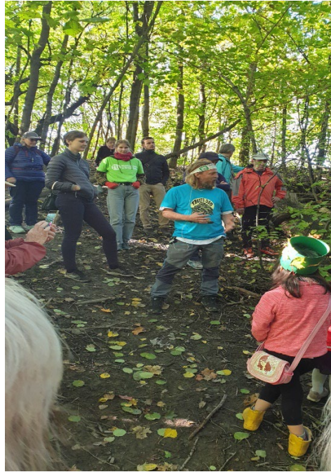
Soppsafari ved Alnaelvas skoger