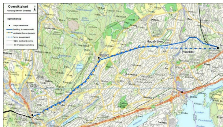
– Bærum kommune må bevare naturen over jordkabelen med samme bredde som under dagens luftkabel for å vise at kommunen tar naturavtalen på alvor, skriver innsenderne. Slik går traseen for mastene gjennom Bærum. (Illustrasjon ved Statnett)

ten fra Hamang krysse Nadde- rudveien sør for Eikeli videre- gående skole og fortsette i nå- værende trasé over toppen.