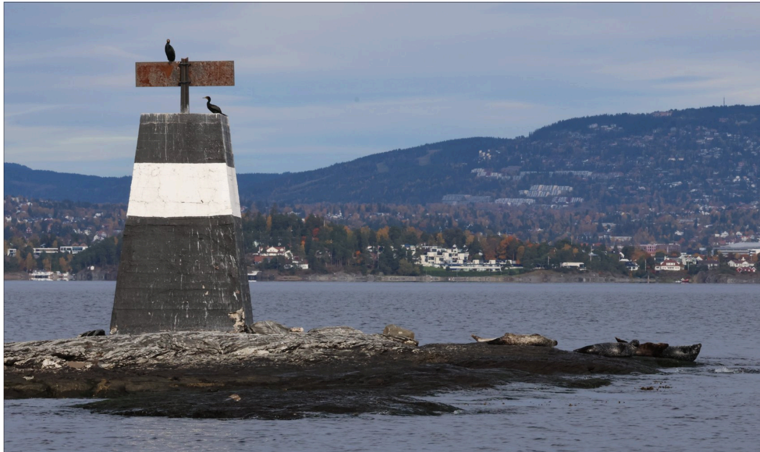
– Gåsungene er utvilsomt det beste marine våtmarksområdet i Indre Oslofjord, skriver innsenderen. Her med skarv på varden og sel i sjøkanten til høyre.

Maksimalt 3.000 tegn inkludert mellomrom. Legg gjerne ved portrettfoto. Retningslinje: Innlegg må signeres med fullt navn og handle om lokale forhold. Send innlegg til debatt@budstikka.no eller budstikka.no/debatt