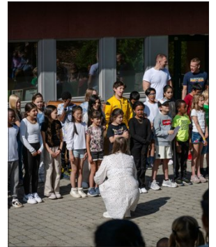
– Alt starter der hjemme, skriver innsenderen i forbindelse med årets skolestart, som er mandag 19. august på barneskolen i Asker og Bærum. Her fra første skoledag på Hagaløkka barneskole i Asker i fjor.