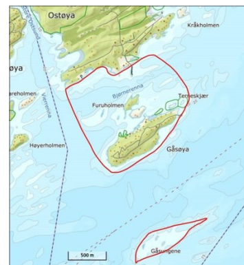
Gåsungene er det lengste sør du kan komme i Bærum og ligger faktisk lenger sør enn Nesøya og Brønnøya i Asker. Kartet er fra et forslag til fredningszone for hummer.

de. Nå skal vi jo verne 30 prosent av landet vårt, da gjelder det å plukke ut de viktigste områdene. I Oslofjorden, også i Bærums del, har vi noen slike. Gåsungene ligger på en klar førsteplass på en slik verneplanliste. Unikt i Indre Oslofjord.