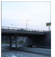
Bleikerveien bro over E18 rehabiliteres i sommer.