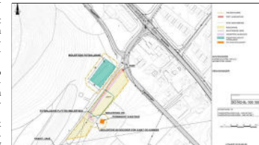
Slik ser de foreløpige planene for riggområde på Hagabråten ut.