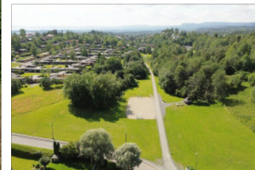
Fra Hagabråten skal den nye kabelen gå i tunnel. Dermed ligger det an til å bli anleggsplass i grøntområdet.