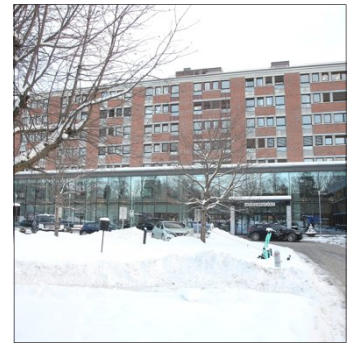
- Tenk at jeg skulle bli fulgt opp på en slik måte, skriver innsenderen om en erfaring med Bærum sykehus.

Det er dere politikere (bevilgende myndighet) i samspill med ledere i ulike etater som har ansvaret for å få ting til å fungere til innbyggernes beste.