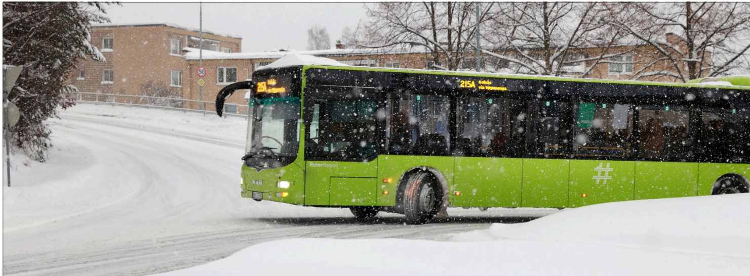
- Dette er så ille at det må til kraftfulle tiltak. Først og fremst må alle ha utstyr som tåler norske vinterforhold. Det gjelder busser, biler i hjemme-sykepleien og skinnegående materiell, skriver innsenderen.

Maksimalt 3.000 tegn inkludert mellomrom. Legg gjerne ved portrettfoto. Retningslinje: Innlegg må signeres med fullt navn og handle om lokale forhold. Send innlegg til debatt@budstikka.no eller budstikka.no/debatt