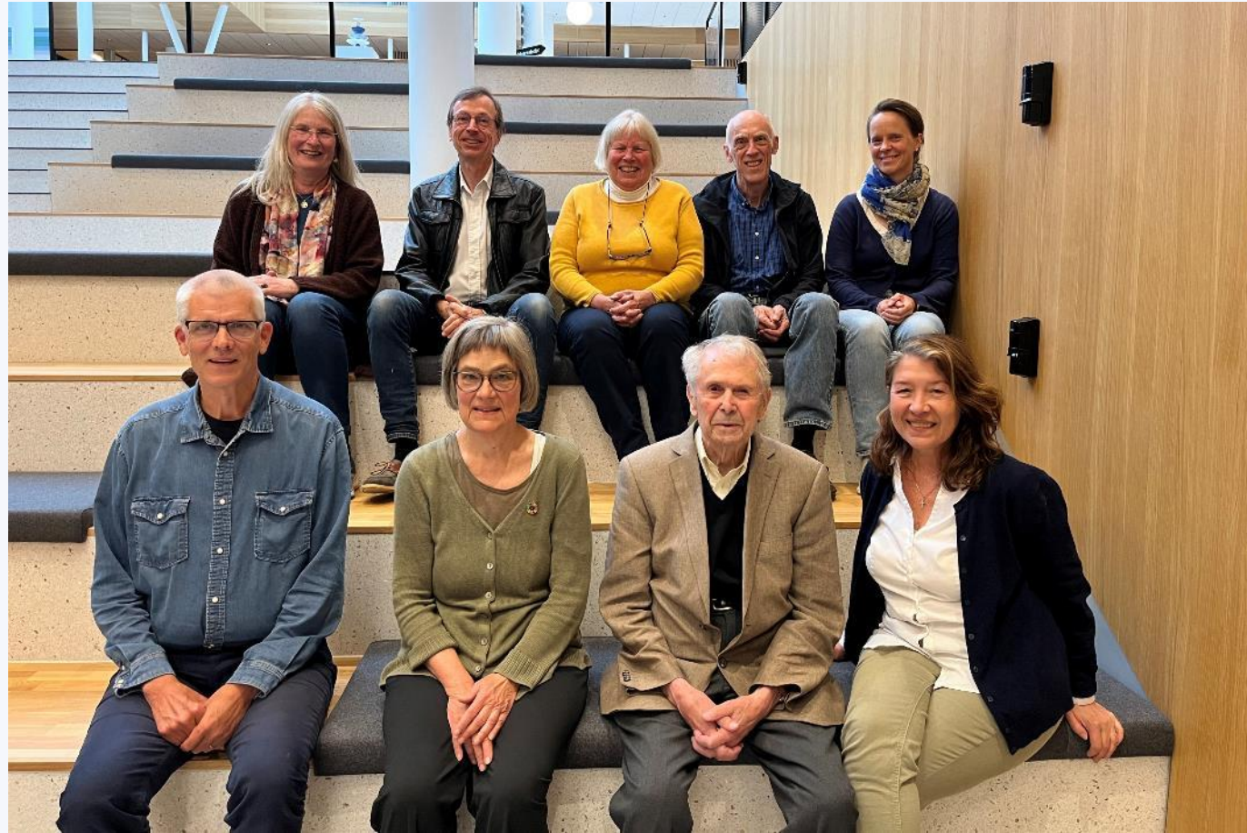
Styret 2024.