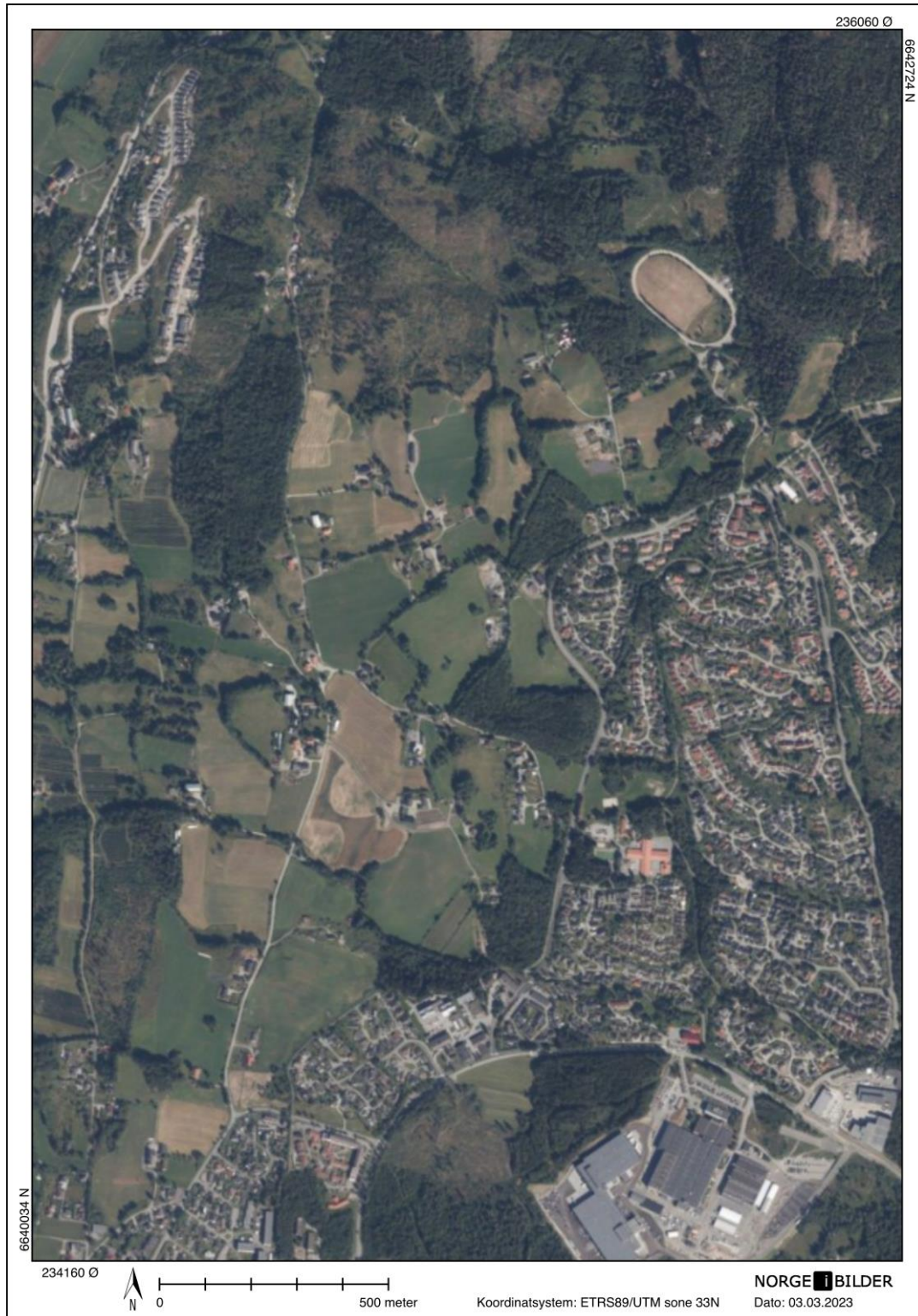
Flyfotografiene viser konsekvensene av kommunal arealforvaltning på Tranby og Nordal gjennom 60 år (1962 – 2022). Prinsippet om samlet belastning lovfester "bit for bit"-tankegangen. Det skal bidra til å effektivisere føre var-prinsippet.