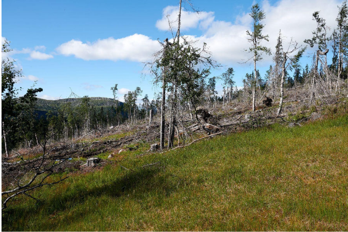
Storlia - myr i forgrunnen.