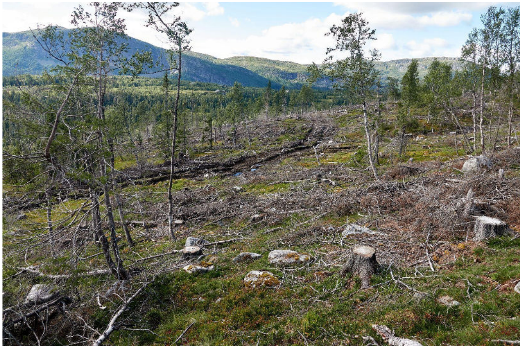
Storlia- køyrespora viser innslag av ein del myr i området.

Storlia ligg like under skoggrensa og grensar opp mot villreinområdet. Hogstfeltet, som er nær identisk med hyttefeltet er på om lag 350 dekar. Hyttene vil bli liggjande eksponert i landskapet, og vera skjemmaende på lang avstand.