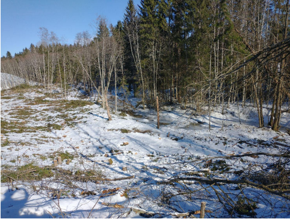
Gråor pregar området. All gråor burde vore spart.