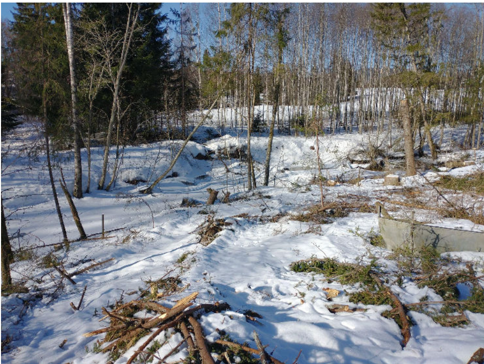
Lite vegetasjon står igjen.