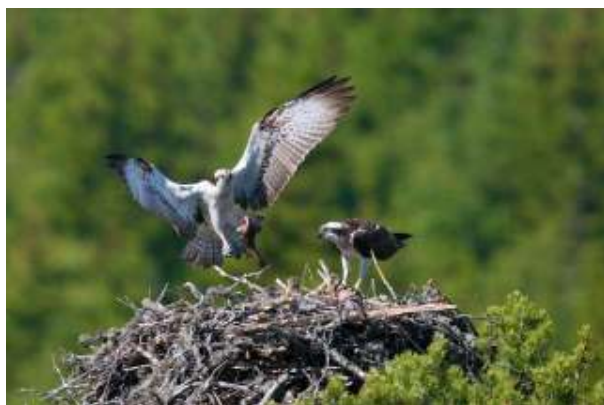
Hannen kommer med en ørret til reiret (Foto: K.A.Dokka).

Eggleggingen fant trolig sted siste uka i april. Hunnen ruget mest, mens hannen brakte fisk til reiret 2-3 ganger i døgnet og ruget også i korte perioder (til sammen ca. 3-4 timer per dag) mens hunnen spiste. Klekkingen skjedde mellom 1. og 7. juni. Tre unger, der den ene var mindre enn de to andre. Hannen brakte nå fisk til reiret typisk 5-6 ganger per dag, i hovedsak ørret. Det var hunnen som matet ungene. I juli leverte hannen 5-8 fisk per dag. Hunnen vedlikeholdt reiret ved å tilføre det kvister og lavdotter. Den minste ungen døde i slutten av juli, mens de to største var i gang med flygetrening. I begynnelsen av august var begge ungene fullt flygedyktige. I august leverte også hunnen fisk til reiret et par ganger. Hunnen forlot lokaliteten medio august, mens hannen fortsatte å levere fisk til ungene, men det ble nå stadig lenger mellom hver levering. Litt spesielt: et tårnfalkpar hekket dette året i de nedre delene av fiskeørnreiret.