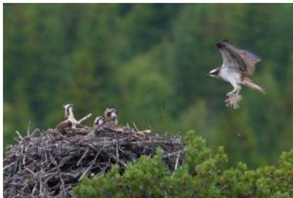
Hunnen bringer en lavdott til reiret.

Et annet forhold som berører fiskeørnas hekkebiologi, har med parets reirvedlikehold å gjøre. Som nevnt over, bringer hunnen kvister og lavdotter til reiret i ungeperioden. At store, gråe lavdotter (reinlav, islandslav o.l.), og kvister med lavdotter på bringes til reiret er også observert ved flere andre reir. Kan det tenkes at laven, som inneholder lavsyre, har en antiseptisk effekt som bidrar til å dempe lukt og annen plage fra råtnende fiskerester i reiret? Foreløpig er det ikke funnet noe om dette i litteraturen, men problemstillingen kan være interessant å følge opp videre.