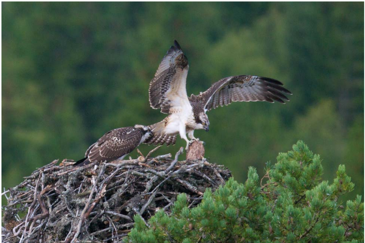
To flygedyktige fiskeørnunger på et reir i Kongsberg i august 2008.