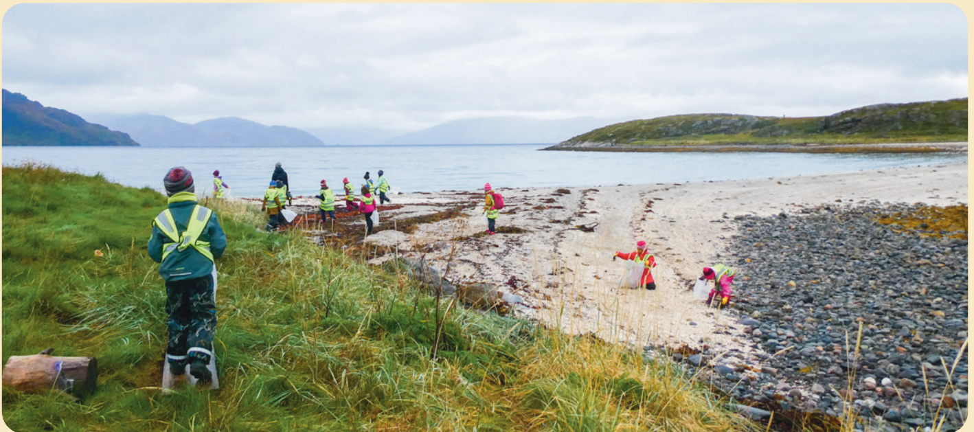
(Strandrydding. Foto: Christina Koch)

Les mer om Vårt Hav Troms og Finnmark her.