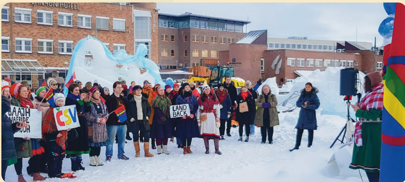
(Fosen-markering i Alta. Foto: Kjell Derås)

Det ble holdt støttemarkering for Fosen-aksjonen i Alta og Kautokeino. Den 11. oktober 2021 slo Høyesterett fast at vindkraftutbyggingen på Storheia og Roan i Trøndelag er i strid med artikkel 27 FNs konvensjon om sivile og politiske rettigheter. Høyesterett i stor-kammer kom enstemmig fram til at vedtakene om konsesjon og ekspropriasjonstillatelse er ugyldige. Les mer her.