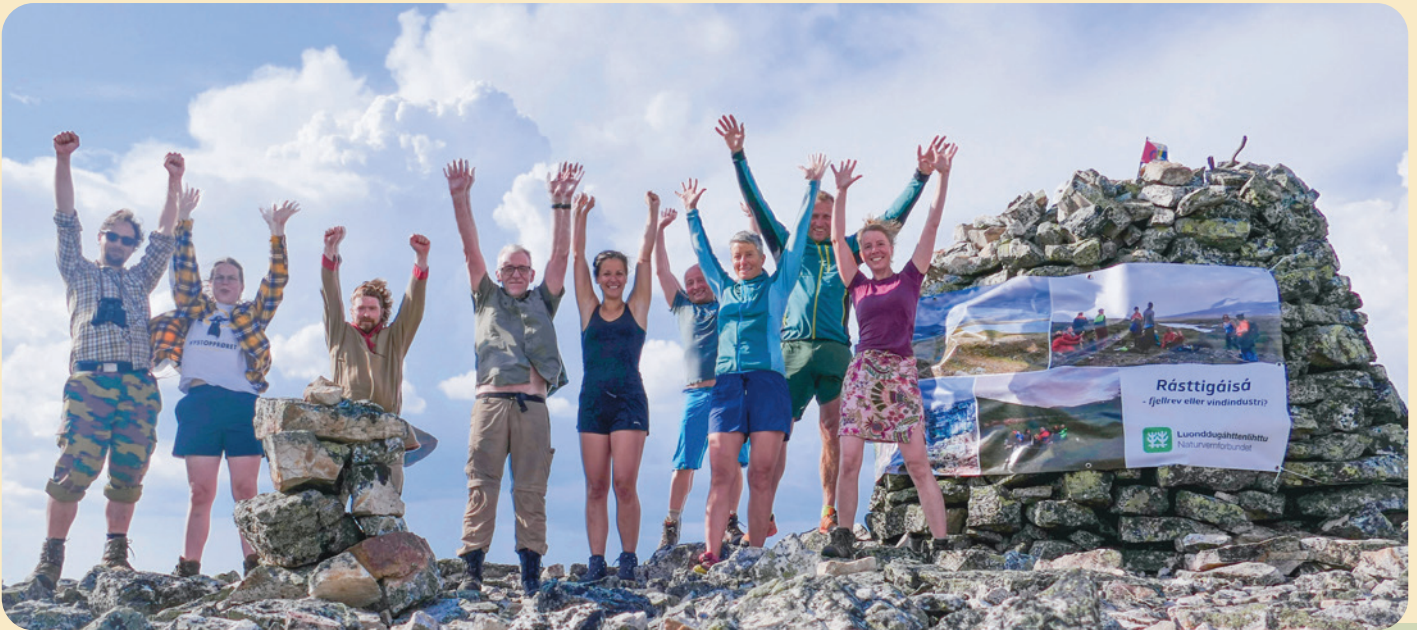
(Markering på Rásttigáisá.)

Davvi vindkraftverk er planlagt i et av Norges største sammenhengende naturområder med uberørt preg. Inngrepsfrie områder har svært stor verdi for landskapsøkologien og naturmangfoldet i kraft av sin inngrepsfrihet. Området har et helt unikt arts mangfold av utrydningstruede arter som krever store arealer, blant annet fjellrev og snøugle, som tett følger smånagerbestanden. Naturvernforbundet er derfor sterkt imot utbyggingen av Davvi vindkraftverk. Se hele saken her.