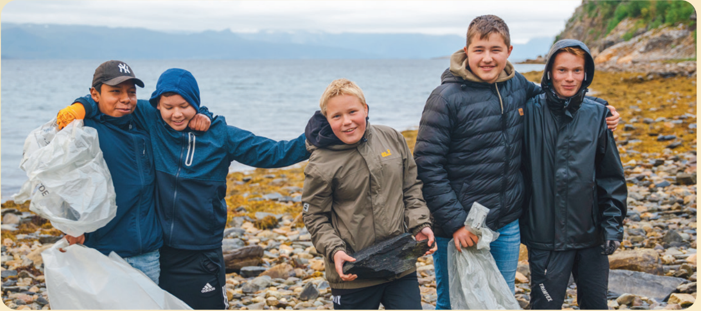
(Miljøvegiserne. Foto: Elias Rasch)

og prosjektet fortsettes i tiden fremover. Se video om Miljøvegiserne her (nederst på siden). Se Vårt Havs Facebookside her.