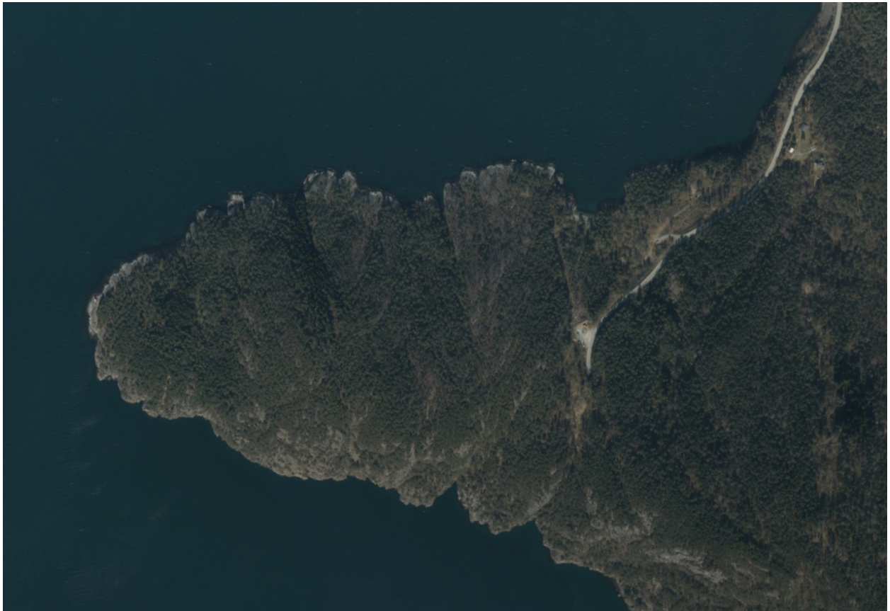
Luftfoto frå området 2022